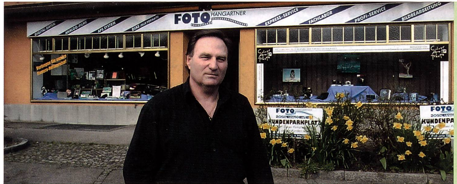
Foto Hangartner in Oberengstringen bietet seinen Kunden einen Vollservice. Mit seinem Fujifilm Frontier 350 verfügt er über ein breites Leistungsangebot – vom kleinen Passbild bis zum anspruchsvollen Industrieauftrag. Seit kurzem ist die neueste Frontier-Software installiert, mit der in einem Scan-Durchgang auch gleich eine CD gebrannt werden kann.

Herz des Geschäftes ist das Fujifilm Frontier 350, das ebenso zur Ausgabe digitaler Bilddaten genutzt wird als auch zur Verarbeitung sämtlicher analoger Aufträge. « Ich hatte das Frontier zum ersten Mal auf der PMA vor zwei Jahren in Las Vegas gesehen und wusste damit sofort, wie die Zukunft eines erfolgreichen Fotogeschäftes aussehen würde. Seit ich das Frontier in Betrieb habe, hat sich diese Vision bestätigt: Der moderne Fotofachhandel braucht ein Gerät, das den Schritt in die digitale Fotografie lückenlos mitmacht, und das ist mit dem Frontier sichergestellt. »