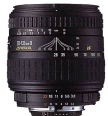
28-135 mm F3,8-5,6 Aspherical IF Macro

Das kompakte SIGMA Zoomobjektiv bewältigt von 28 mm Weitwinkel- bis hin zu 135 mm Teleaufnahmen alles. Mit der Telemakro-Funktion sind Nahaufnahmen bis zum Abbildungsmaßstab von 1:2 möglich. Eine asphärische Linse minimiert sphärische und astigmatische Aberration für hervorragende optische Leistung. Die Innenfokussierung erleichtert die Verwendung von Polarisations- und Effektfilttern dank einer nicht rotierenden Frontlinse. Ein kompaktes Telemakro-Zoomobjektiv für Weitwinkel-, Tele- und Nahaufnahmen – so vielseitig wie jeder engagierte Fotograf.