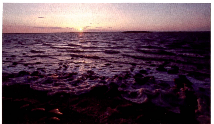
Polaroid 8 bit