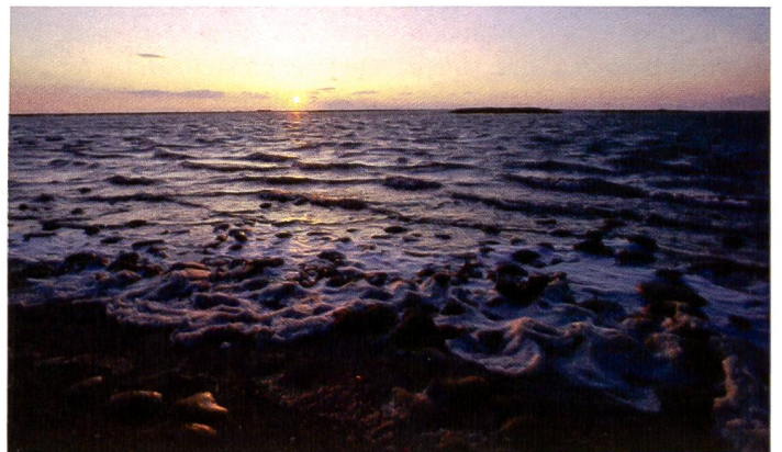
Kodak 8 bit