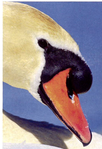
Die Ära der Trommelscanner ist keineswegs vorbei: Der Scan links (mit Nikon LS4000) zeigt weniger Details als der Scan rechts, der auf einem High-End Trommelscanner realisiert wurde.

setdruck zur Verfügung. Bei Bedarf kann man nachträglich wieder auf das Filmoriginal zurückgreifen, sollte z.B. doch einmal ein hochwertiger Trommelscanner benötigt werden. Diese Reserve fällt bei digitalen Aufnahmen weg, weil man sich dann von Anfang an auf eine bestimmte Auflösung und Bildqualität (Farbtiefe, Kompressionsstufe) festlegt. Zwar lassen sich die Quelldaten rechnerisch skalieren, doch bringt dies natürlich keinen Qualitätsgewinn, weil die effektive Bildinformation ja nicht zunimmt, sondern lediglich auf mehr Pixel verteilt wird.