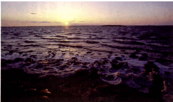
Canon 12 bit

Die Auswahl von fünf Scannern für diesen Test wurde