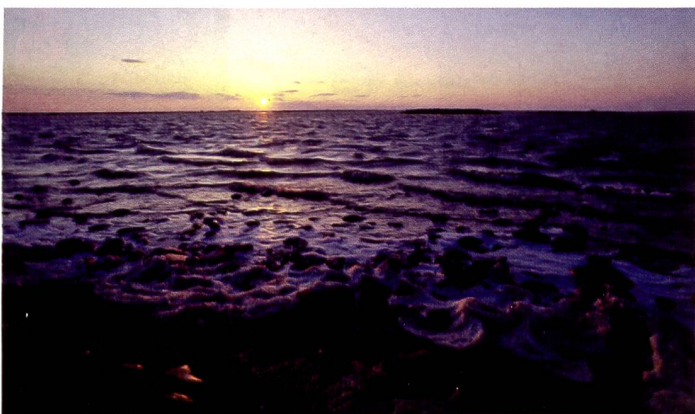
Nikon 14 bit