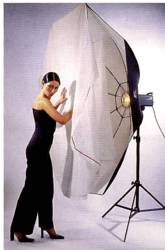
Octalite für Ganzkörperaufnahmen. Flächenleuchten verteilen das Licht und machen es weich.

schiebungen der Farbbalance kommen. Dieser Effekt kann natürlich auch wieder kreativ genutzt werden, wenn zum Beispiel bei neutralem Hauptmotiv im Hintergrund ein besonders warmes (oder kaltes) Licht für Ambiance sorgt.