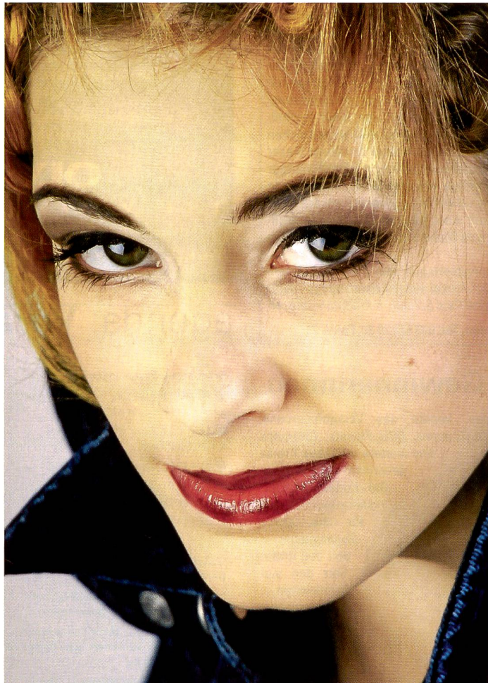
Zwei Kompaktblitzgeräte mit Schirmen reichten aus, um dieses Porträt auszuleuchten, ein weiteres Licht erhellte den Hintergrund.

Wer seine Motive im Studio perfekt ausleuchten will, kommt um entsprechende Lichtinstallationen nicht herum. Diese müssen nicht aufwändig und kompliziert sein. Kompaktblitzgeräte sind vielseitig und einfach zu handhaben. Wie das funktioniert, worauf es ankommt, steht hier.