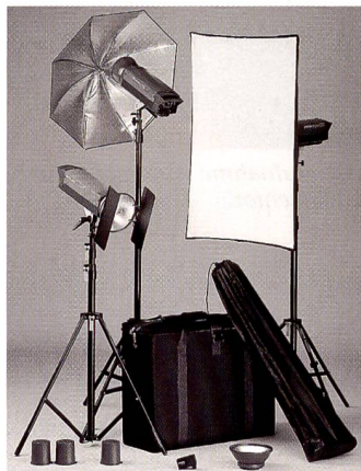
Das Location Set von Broncolor ist schnell betriebsbereit.