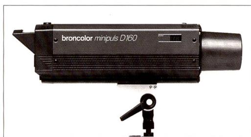
Broncolor Minipuls, leistungsstarkes Gerät, in der Schweiz entwickelt und produziert.

Dia- oder Negativfilm belichten. Wer im Kleinbildformat arbeitet, kann aber in der Regel kaum auf Polaroid-Rückteile zurückgreifen. Viele Blitzhersteller bieten deshalb eine sogenannte Pyrexglocke für ihre Geräte an. Diese umgibt sowohl die Pilotlampe