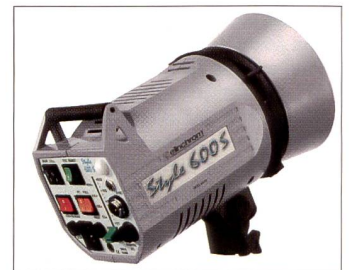
Modernste Blitztechnik in robustem Gehäuse: Elinchrom Style.

ohne sich Rechenschaft über den genauen Verwendungszweck zu geben. Oft wären aber ein bis zwei Leuchten ausreichend, wenn nur die Lichtformer mehr hergeben würden. Wird zum Beispiel das Licht hauptsächlich für Porträts verwendet, müsste man sich die Anschaffung einer Softbox überlegen.