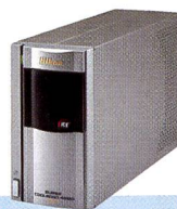
SUPER COOLSCAN 4000 ED: DER NEUE PROFI-STANDARD.