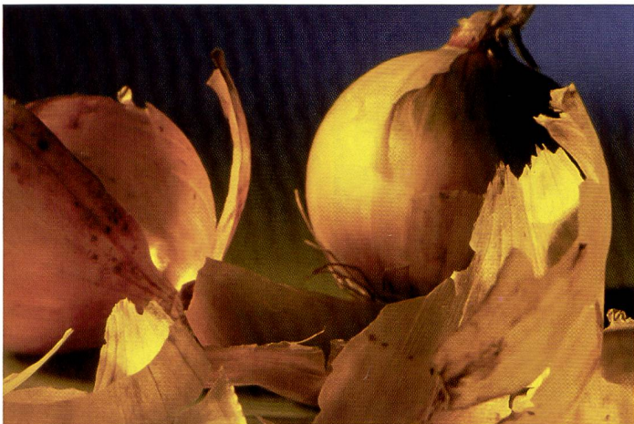
Farbiges Licht sorgt für Ambiente: Diese Aufnahme wurde mit einer gelben Folie vor dem Wabenfilter ausgeleuchtet.

Weitwinkelreflektoren eignen sich für den Einsatz mit Schir-