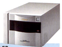
SUPER COOLSCAN 8000 ED: MULTIFORMAT FÜR DIE DRUCKVORSTUFE.