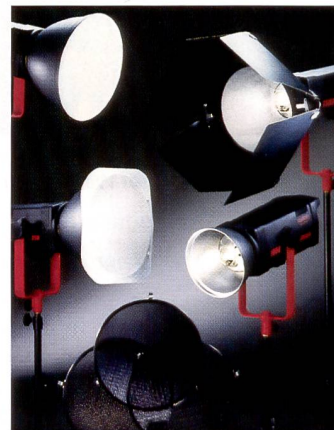
Lichtformer machen das Licht weich oder hart, je nach Wunsch