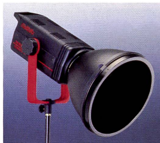
Multiblitz-Gerät mit Wabenfilter

grund. Alle Anbieter haben Einsteigersets im Sortiment, oder gewähren einen zusätzlichen Set-Rabatt, was grundsätzlich günstiger ist, als wenn jede Komponente einzeln gekauft wird. Wichtig ist neben der Leistung vor allem das Angebot an Zubehör. Wie bereits erwähnt sollte den angebotenen Lichtformern ein besonderes Augenmerk gelten.