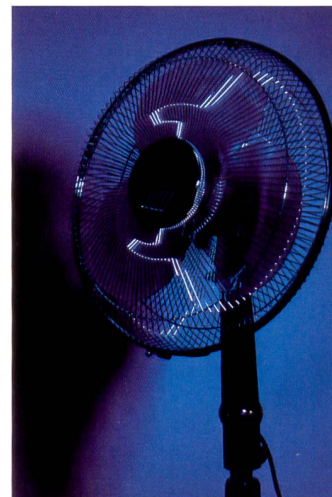
Ein Kompaktgerät mit Wabenfilter und Farbfolie genügt für diese stimmige Aufnahme.

während der Ventilator mit einem einzigen Blitzgerät mit Blaufilter gemacht wurde. Bei der Aufnahme «Sandra mit Ventilator» wurde das Hintergrundlicht eingefärbt, um die nüchterne, kühle Atmosphäre zu unterstreichen. Blitzlicht