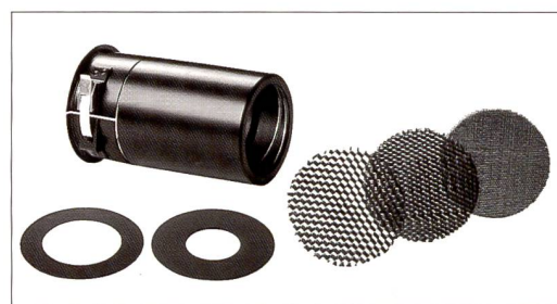
Broncolor Spottubus: Mit verschiedenen Wabenfiltern wird das Licht nach Wunsch geformt.

hohem Masse. Im Übrigen gilt es auch Kompaktblitzgeräte – wie Kamera und Objektiv auch – gelegentlich zu warten. Werden die Reflektoren regelmässig gereinigt, wird sich das auch positiv auf die Lichtausbeute auswirken. Ersatzsicherungen und ein zweites