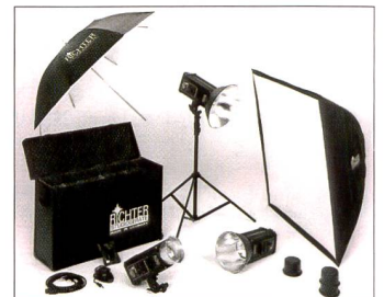
Günstige Sets wie hier von Richter ermöglichen den Einstieg in die Studiofotografie.

Für Ganzkörperaufnahmen wird indes bereits ein grösseres Flächenlicht benötigt, also beispielsweise ein Octalite (allerdings muss dann auch die Leistung der Leuchte entsprechend hoch sein). Sollen aber kleine und kleinste Gegenstände fotografiert werden, sind neben einem flächigen Licht für die Grundausleuchtung auch gerichtete Spots gefragt, die Details hervorheben und der Aufnahme Charakter verleihen. Konkret heisst das: Für jede Lichtquelle sollten mehrere Lichtformer vorhanden sein. Im Zweifelsfall lieber auf eine weitere Leuchte verzichten und dafür mehr Lichtformer einkaufen.