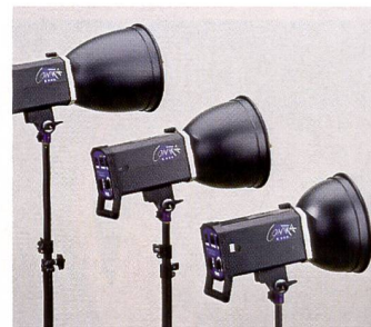
Kompaktblitzgeräte von Hensel