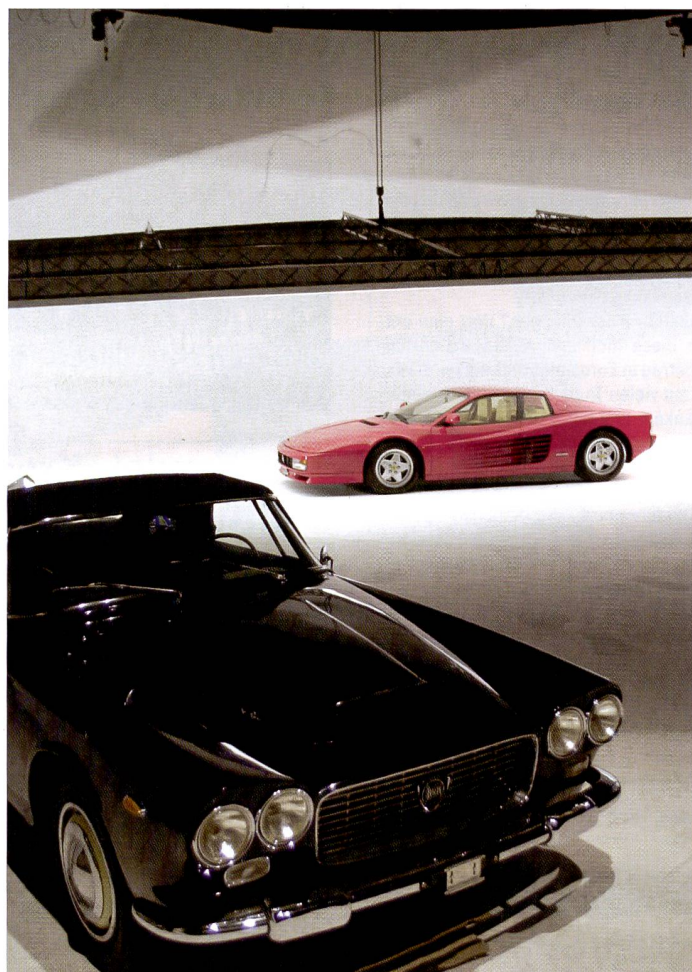
Autoproduktionen mit mehreren Fahrzeugen sind kein Problem, die Studios gehören zu den grössten in Europa.

Hinter dem Namen Swisstudio steht ein interessantes Mietkonzept, das Fotografen und Filmern erlaubt, ihre Produktionen in grossräumigen und bestens ausgerüsteten Mietstudios zu realisieren. Wir haben uns in den Swisstudios in Bürglen bei Weinfelden umgesehen.