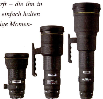
300 mm F2,8 EX APO HSM

Dank des neuen ELD-Glases (Extraordinary Low Dispersion) wird eine enorm kontrastreiche, hochauflösende Qualität erzielt. Die Innenfokussierung gewährleistet eine präzise, leichte Fokussierung und der HSM-Antrieb sorgt für einen schnellen, leisen Autofokusbetrieb. Eine manuelle Fokussierung steht jederzeit zur Verfügung. Die Filterschublade mit der von aussen bequem zu bedienenden SIGMA-Drehfassung ermöglicht das problemlose Arbeiten mit einem Zirkular-Polarisationsfilter