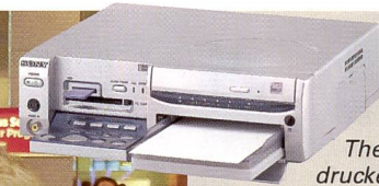
Thermosublimationsdrucker mit integriertem CD-Brenner: Sony DPP-SV88.