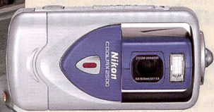
Nikon CP 2500

Zur einzigartigen Konzentration von Technik und Trends kamen, im Gegensatz zum Vorjahr, mehr Entscheidungsträger und Experten aller Branchen, die durch die 27 Ausstellungshallen drängten. Vorgestellt wurden erstmals in Europa Kameras und Produkte der Imaging Branche die wenige Wochen zuvor an der PMA in den USA ihre Weltpremiere hatten. Auch in Hannover gab es Innovationen in den Bereichen Consumer Electronics, Foto, Video und Imaging sowie von digitalen Eingabegeräten und -systemen.