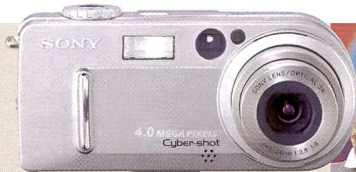
Sony Cybershot DCS-P9: Klein, rund, handlich.

A40, PowerShot A100 und EOS D60, Casio Exilim EX-S1 und Exilim EX-M1, Fujifilm FinePix S2 Pro, FinePix S602 Pro und FinePix F601 Zoom, Kodak DX 4900, Minolta Dimage F100, Dimage X und Dimage 7i, Mustek GSmart 300, MDC 3000 und MVVR-