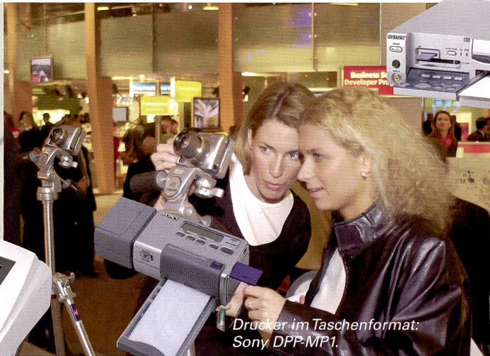
Drucker im Taschenformat: Sony DPP-MP1.