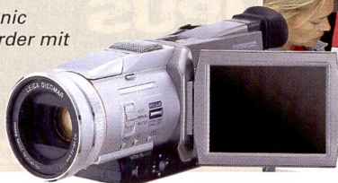
Panasonic Camcorder mit 3CCD.