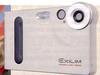
Casio Exilim EX-S1: die kleinste Digitalkamera der Welt?