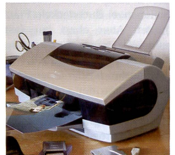
Canon S900 überzeugt mit exzellenten Ergebnissen.

grössert die zu druckenden Bilddaten, teilt sie auf mehrere Seiten auf und druckt diese Seiten dann auf separate Blätter. Werden diese Blätter wieder aneinandergesetzt, erhält man einen entsprechend vergrösserten Ausdruck in Posterformat.