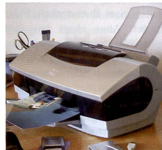
Canon S900 überzeugt mit exzellenten Ergebnissen.

grössert die zu druckenden Bilddaten, teilt sie auf mehrere Seiten auf und druckt diese Seiten dann auf separate Blätter. Werden diese Blätter wieder aneinandergesetzt, erhält man einen entsprechend vergrösserten Ausdruck in Posterformat.