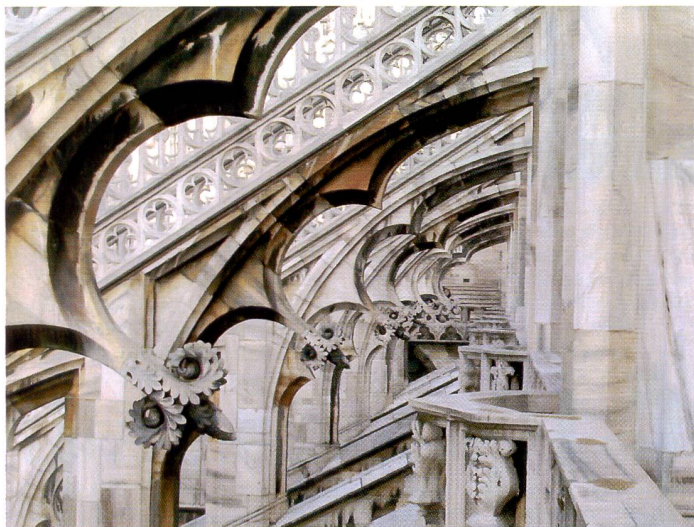
Natürliche, sehr differenzierte Detailwiedergabe auf Glanzphotopapier. Druckerkalibrierung mit geräteeigenem Farbprofil.

Canon empfiehlt die Verwendung des Professional Foto-