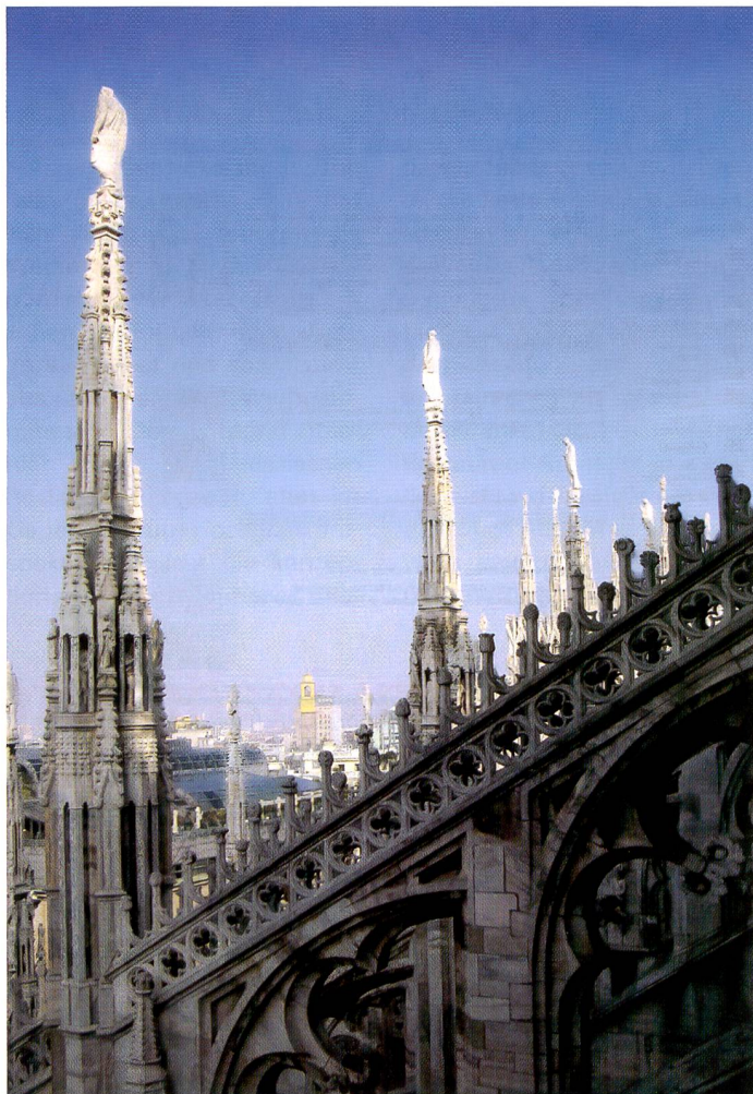
Randlos: Dieses Bild druckte der Canon S900 innert Minuten aus.

Der Konkurrenzkampf im Druckersegment geht unvermindert weiter. In immer kürzerer Folge werden neue Inkjet Printer auf dem Markt eingeführt. Gleichzeitig werden diese immer günstiger und dennoch technisch ausgefeilter.