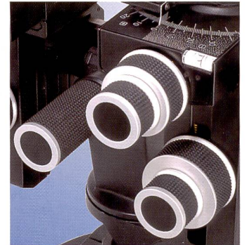
Trendig: die Einstellknöpfe der p3 sind hell eloxiert.

Völlig neu konstruiert sind die Kupplungsrahmen, mit denen sich die Aufnahmefläche der Sinarback Digitalrückteile op-