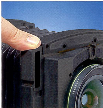
Sichere Verriegelungen an den Kupplungsrahmen.

Mit der Sinar p3 hat Sinar ihr Kamerasystem um eine wesentliche Einheit erweitert,