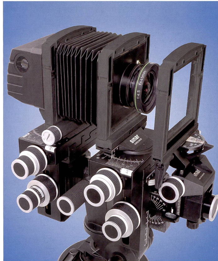
Die neue Sinar p3 greift auf die bewährten Gelenkblöcke der p2 zurück. Sie ist dadurch äusserst stabil und ideal für Digitalrückteile.

Mit der Sinar p3 werden sämtliche Schnittstellen inkl. Blitzsynchronisation und Stromversorgungen der Kamera und des Sinarbacks in einem Kabel vom Rechner zur Kamera zusammengefasst. Sie verfügt über eine integrierte Verdrahtung, die das Rückteil und den Verschluss direkt miteinander verbindet, so dass die