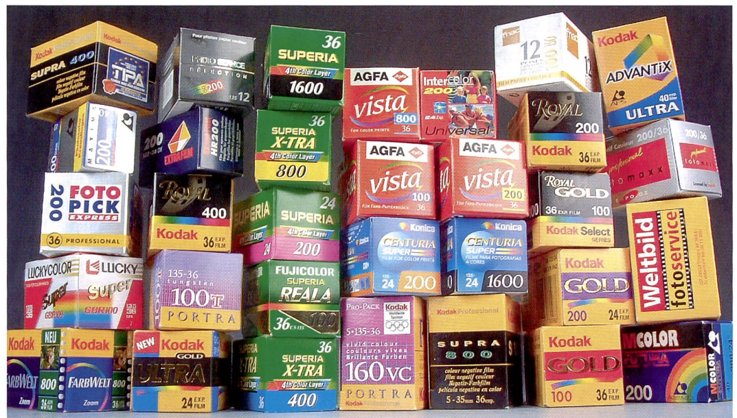
Das weltweite Angebot an Farbnegativfilmen ist kaum überschaubar. Die Tatsache, dass alle Filme heute im gleichen Prozess (C-41) entwickelt werden, vereinfacht die Verarbeitung.

stattet worden. Kodak spricht vom jeweils feinsten Korn in den beiden Empfindlichkeitsklassen. Die von den Royal Filmen genutzte weiterentwickelte T-Grain-Technologie mit plättchenförmigen lichtempfindlichen Silberkristallen