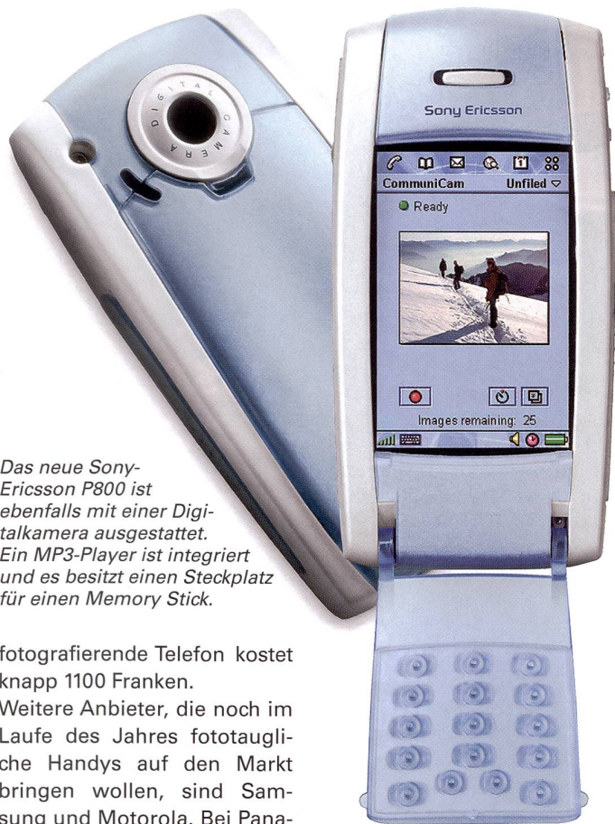
Das neue Sony-Ericsson P800 ist ebenfalls mit einer Digitalkamera ausgestattet. Ein MP3-Player ist integriert und es besitzt einen Steckplatz für einen Memory Stick.