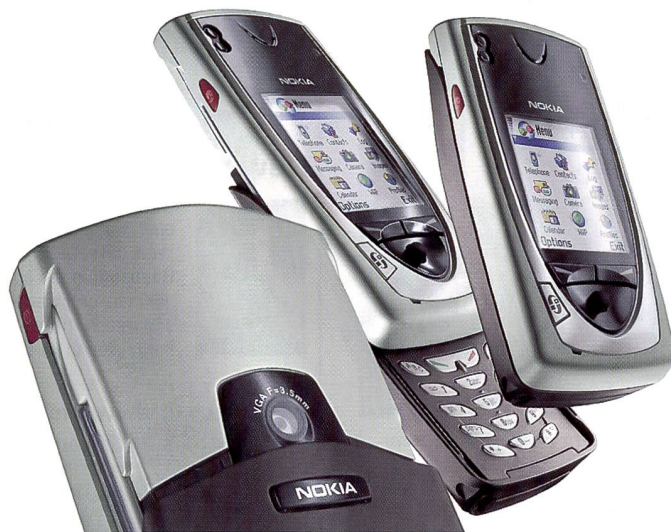
Nokia steigt mit dem Modell 7650 ins Photo Messaging ein.

Schon lange vorausgesagt, jetzt sind sie da: die Handys, mit denen man auch fotografieren und die Aufnahmen gleich verschicken kann. Bricht ein neuer Trend an oder sind die beiden ersten Modelle von Nokia und Sony-Ericsson Eintagsfliegen?