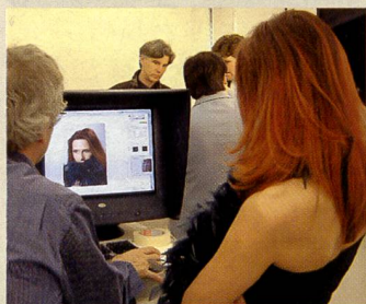
Die PROFESSIONAL IMAGING 03 findet in der Halle 1 der Messe Zürich statt.