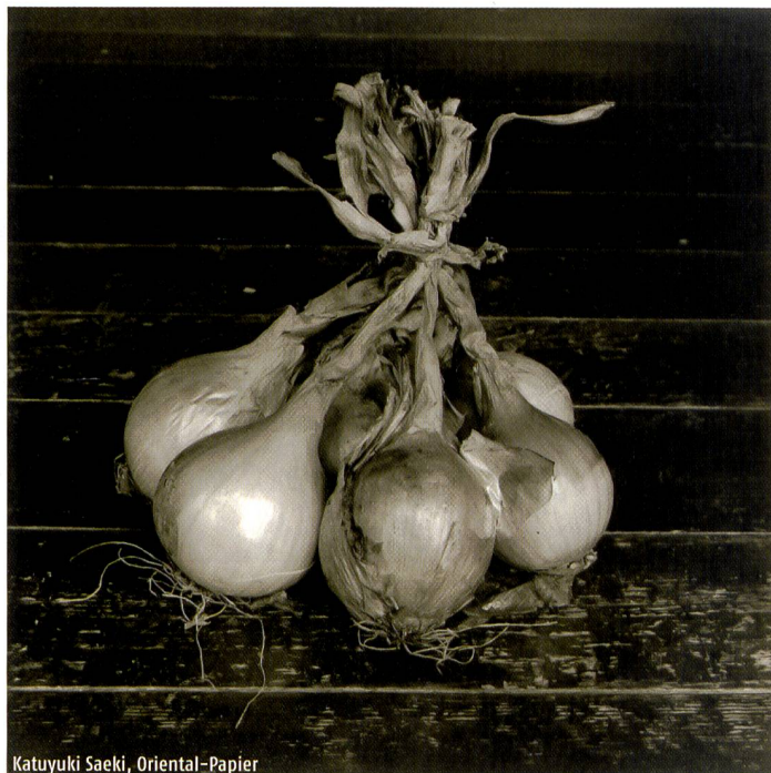
Katuyuki Saeki, Oriental-Papier

Farbkuppler aus den Portra Filmen haltbarer als vergleichbare Papiere für den Farbprozess. Es ist auch schärfer und besitzt einen größeren Dichteumfang sowie ein ausgezeichnetes Reziprozitätsverhalten, das gleichbleibend gute Ergebnisse mit kurzen und langen Kopierzeiten bietet. Professional Portra ermöglicht Schwarzweiss-Prints