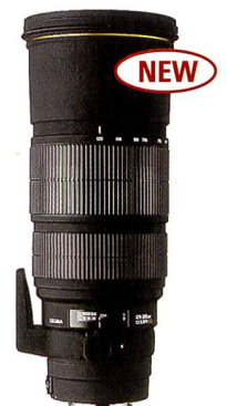
SIGMA APO 120-300 mm F2,8 EX IF HSM

Die einzigartige Anmut und Pracht werden bei dieser Parade der Wachen anlässlich des Geburtstags der Königin von England und Nordirland voll zur Geltung gebracht. Das dabei verwendete SIGMA Tele-Zoom-Objektiv, das eine grosse Lichtstärke von F2,8 im gesamten Brennweitenbereich zur Verfügung stellt, hat die Szene mit aussergewöhnlicher Lebendigkeit festgehalten. Durch den grossen Zoombereich ermöglicht dieses Objektiv dem Fotografen, vor endgültiger Festlegung des Aufnahmewinkels, die Einstellung verschiedener Bildrahmen für ein Motiv von einer festen Aufnahme position aus. Die Verwendung von Elementen aus SLD-Glas (Special Low Dispersion) garantiert eine optimale Bildqualität, frei von chromatischer Abberation. Der HSM-Antrieb (Hyper Sonic-Motor) sorgt für einen schnellen, leisen Autofokus-Betrieb. Das Objektiv ist erhältlich in den Anschlüssen Nikon AF-D, Canon AF und Sigma AF. Um die Vielseitigkeit dieses Objektivs noch zu vergrössern, sind APO Telekonverter als optionales Zubehör erhältlich.