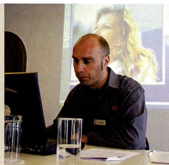
An der Fachhandelstagung.