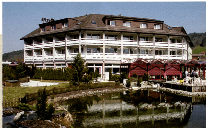
Der «Kappelerhof» bot eine ideale Infrastruktur und gute Küche.