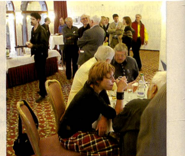
Zeit für «Fachgespräche».