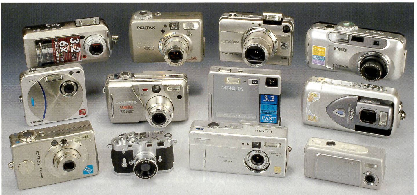
Ein ungewöhnliches Dutzend. Viele aktuelle Digitalkameramodelle fallen durch ihre taschenkompakten Abmessungen, besondere Eigenschaften oder ein aussergewöhnliches Design auf. Wir haben einige ausgewählt, die nicht miteinander vergleichbar sind.

Sie haben sich im Markt bewährt und wurden laufend verbessert. Die Digital Ixus V3 glänzt mit kleinen Details, die das Fotografieren erleichtern und auch die anschließende Weiterverwendung der Bilder vereinfacht. So erkennt die Kamera beispielsweise automatisch, ob ein Bild im Hoch- oder Querformat aufgenommen wurde und dreht dieses bei der