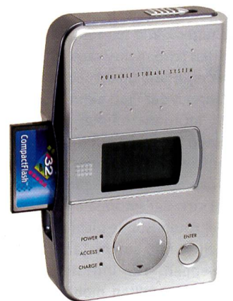
Portable Storage System

und liest CF-Karten vom Typ I und II. Andere gängige Speicherkarten können über entsprechende Adapter eingelesen werden. Dank dem integrierten Li-Ion Akku kann das Gerät bis zu 45 Minuten lang netzunabhängig betrieben werden. Das On Screen Menu ermöglicht eine einfache