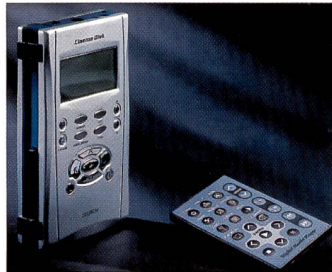
bild und automatischer Skalierung auf Monitorgrösse (funktioniert nur mit JPEG-Bildern). Bei Diaschauen sind Überblendefekte und die Unterlegung mit Hintergrundmusik möglich. Darüber hinaus kann die Cinema

Ein Multifunktionsgerät mit den Funktionen eines mobilen Festplattenspeichers (20 GB und mehr), eines MP3-Players, eines Kartenlaufwerks und eines MPEG-Videoplayers stellt das Deltron Cinema Disk dar. Ausgestattet mit CF-III-Slot und USB-2-Schnittstelle, lassen sich digitale Bilder zwischenspeichern, über den JPEG-Player auf dem Fernseher oder über den Beamer wiedergeben, einschliesslich Diaschau, Zoom, Schwenken, Mini-