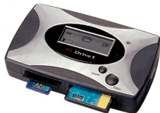
Vosonic X's Drive II

Der X's-Drive I (VP2030), auch unter den Bezeichnungen X-Drive, Pixxbox oder Best-Drive im Handel, ist mit einer Speicherkapazität von 20, 30 oder 40 GB ausgestattet. Es akzeptiert alle gängigen Speicherkarten, xD-Karten