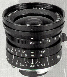
LEICA ELMARIT-M ASPH 1:2,8/24 mm