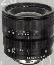
LEICA-VARIO-ELMAR-R ASPH 1:3,5-4,0/21-35 mm