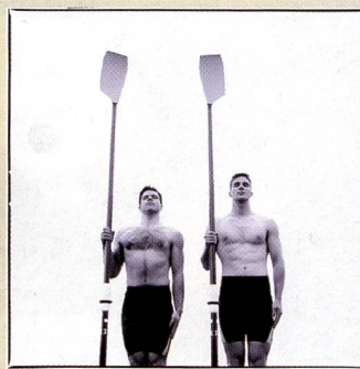
Row for gold: Die Werbefotografie war eher untervertreten. Hier die Arbeit von Comenius Röthlisberger, entstanden für die Imagebroschüre von Saurer.