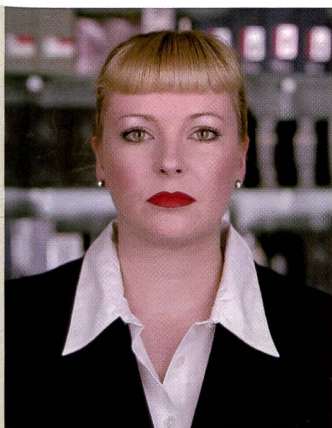
Esthéticiennes: Das Projekt von Raphael Hefti, eine Porträtsérie mit Parfümverkäuferinnen wurde mit dem Magazin Fotopreis 2002 ausgezeichnet.

Aus den über 535 Arbeiten mit insgesamt mehr als 3000 ausgesetzten Bildern wurden in mehre-