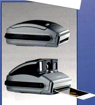
Das flache Design passt in jede Aktentasche. VP Fr. 79.-

Polaroid One. One Hand. One Touch. Und der schnellste Weg zum Bild.