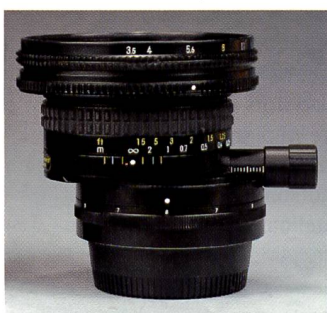
Ein normales Weitwinkelobjektiv, verglichen mit dem PC-Nikkor 1:3,4/28mm. Mit Hilfe der Rändelschraube lässt sich die Shiftbewegung genau dosieren, ausserdem kann das Objektiv rotieren, um Aufnahmen im Hoch- wie im Querformat zu korrigieren.

geöffneter Blende. Bringt man aber zustande, dass sich die gedachten Linien der Objektebene, der Objektivenebene und der Filmebene auf einem bestimmten Punkt treffen, so wird plötzlich scharf, was eigentlich nicht