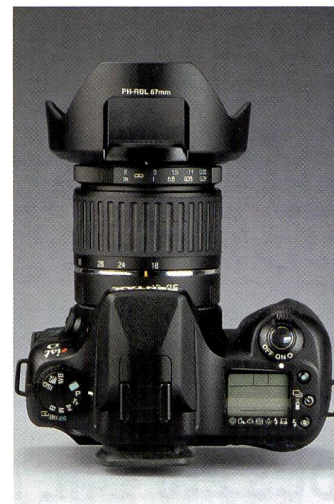
Keine Vignettierung dank einer entfernbarer Durchlichtklappe.