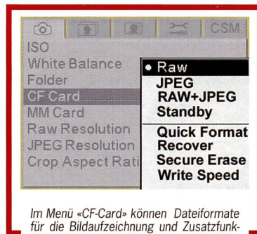
Im Menü «CF-Card» können Dateiformate für die Bildaufzeichnung und Zusatzfunktionen («Format», «Recover» und «Write Speed») ausgewählt werden.

Aufgrund der hohen Auflösung der Pro14n (14 Megapixel) und den damit verbundenen grossen Datenmengen ist die Wahl des Speichermediums von besonderer Wichtigkeit. Eine neue Firmwarefunktion gestattet nunmehr, die Schreibgeschwindigkeit der Speicherkarte in der Kamera zu testen. Die Technologie der «Write Accelerated» Speicherkarten wird