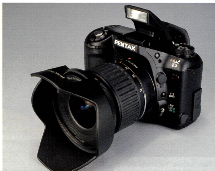
Die Pentax «*ist Digital» überrascht durch ihre kompakten Abmessungen. Trotzdem liegt sie sehr gut in der Hand und sie ist benutzerfreundlich.

Klein und handlich, so präsentiert sich die Pentax *ist D. Die digitale Spiegelreflexkamera überrascht mit einigen raffinierten und benutzerfreundlichen Details.