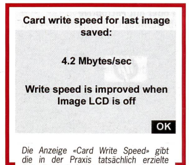
Die Anzeige «Card Write Speed» gibt die in der Praxis tatsächlich erzielte Schreibgeschwindigkeit der CF-Karte in der Pro14n an.

von der Pro14n unterstützt und ermöglicht dadurch Schreibgeschwindigkeiten von bis zu 4,3 MB/Sek. (z.B. Lexar CF 40x Cards, San Ultra,). Die verfügbaren Speicherkapazitäten erreichen bereits 4 Gigabyte. Weitere Vorteile der erwähnten CF-Karten sind ihre mechanische Robustheit und ihr geringer Stromverbrauch.