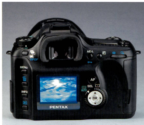
Ergonomisch rund um den Monitor befindet sich das eigentliche Kontrollzentrum der Pentax *ist Digital.