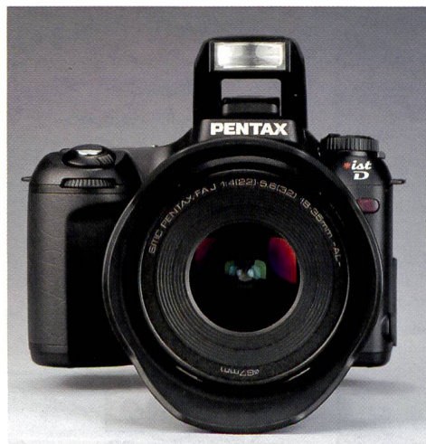
Das SMC Pentax-FA J 1:4-5,6 18-38mm-AL-Zoom-objektiv ist speziell für die Pentax *ist D gerechnet.

Am Betriebsartenwählrad wird die gewünschte Bildqualität, die ISO-Empfindlichkeit (200, 400, 800 und 1600), sowie der Weissabgleich eingestellt. Neben fest eingestellten Positionen für Sonne, Schatten, Bewölkung, Leuchtstoffröhren, Glühlampen und Blitzlicht, sind ein automatischer und drei durch den Anwender definierte Einstellungen möglich. Eine Besonderheit findet sich unterhalb des Betriebsartenwählrades. Per Knopfdruck