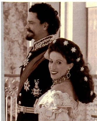
Sepia verleiht dem Bild einen nostalgischen Touch ...

Avalon Computer AG, 8305 Dietlikon, Tel. 01 888 28 38, Fax 01 888 28 39