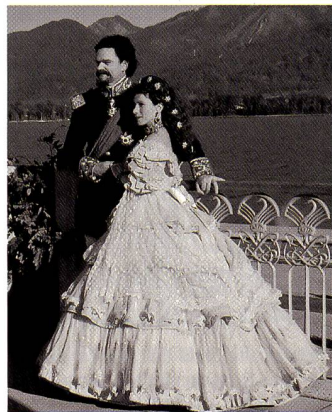
... Schwarzweissaufnahmen haben einen eigenen Charme.