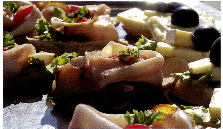
Die Makrofunktion erlaubt eine Annäherung ans Motiv bis zu 12 cm; der hybride Autofokus mit zusätzlichem Sensor und TTL stellt schnell scharf.