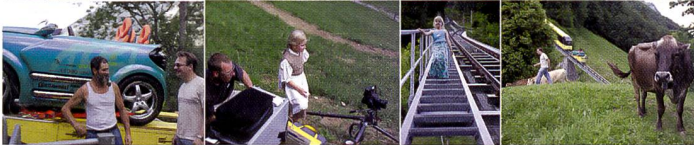
Ein halbes Dutzend Kühe mit einer im Fahrplan kursierenden Bergbahn zu koordinieren stellt eine besondere Herausforderung dar, fotografiert wurde mit einer Mittelformatkamera, 35 mm, Sinarback 54, 1/125 s.

deten aber auch das Fliegen im sehr engen Zeitfenster, in dem die Aufnahme gemacht werden musste. Diese spektakuläre Aufnahme wurde von einem Fernseherteam des deutschen Privatsenders Pro7 dokumentiert. Der Beitrag wird im Sendegefäss «Galileo» am 7. November ausgestrahlt.