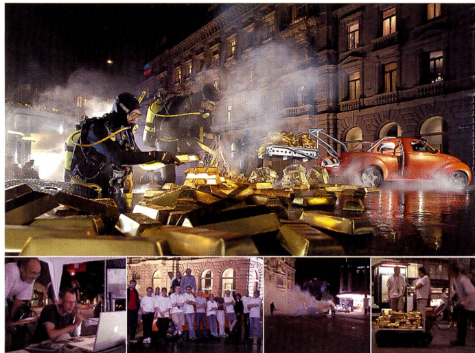
Rund 40'000 Watt HMI-Licht und fünf Nebelmaschinen verleihen der Szene die Atmosphäre, fotografiert mit einer Sinar p3 Fachkamera mit einem 60 mm hochauflösenden Objektiv und 22 Megapixel Sinarback.

In der Innerschweiz, knapp unterhalb der Passhöhe des früher für spektakuläre Autorennen bekannten Klausenpasses, wurde das Frühlingbild des Sinarkalenders kreiert. Auf einer von einem munter plätschernden Bergbach durchflossenen Alpenwiese wurden knapp fünfzig goldene, 70 cm grosse Osterhasen, natürlich aus Plastik und nicht aus Schokolade wie die Originale, stimmig um den Porsche-Umbau Rinspeed Bedouin, ein auf einem Porsche 996 basierenden wandelbaren Pick-up oder Lifestyle-Kombi, herum angeordnet und Zwerge verstecken fleissig ihre Osterschokolade. Da die Produktion des Kalenders im Juni stattfand, war es schwierig, eine entsprechende nicht zu hoch stehende naturbelassene Wiese zu finden. Dabei erwies sich die Wiese am Klausenpass als ideal, allerdings mussten rund 1000 zusätzliche Blumen eingepflanzt werden, um den Frühlingscharakter des Bildes zu betonen. Zur Unterstützung des abendlichen