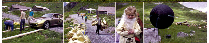
Kein Matchbox-Auto, alles echt! Das Bild wurde, unterhalb der Passhöhe des Klausenpasses, mit einer Mittelformatkamera mit dem Sinarback 54 (22 Mio. Pixel Auflösung) und einem Bron Para Blitzreflektor fotografiert.