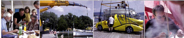
Die aufwändige Gestaltung eines Schiffsunglückes verlangte nach der Perspektiven- und der Schärfenkorrektur der Sinar Fachkamera, mit dem Sinarback 54. Belichtungszeit: 1/250 Sekunde, Objektiv: 35 mm Digital.