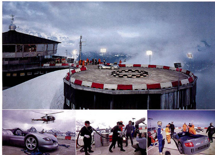
Rundrennstrecke auf dem Schilthorn – eine Abendstimmung in Wolken gehüllt, fotografiert mit einer Mittelformatkamera mit 22 Mio. Pixel von Sinar, 35 mm Weitwinkellinse, 1/500 Sekunde Belichtungszeit, Blende 2,8.

aussergewöhnlichen Panoramaformat von rund 100 x 50 cm gedruckt. Das Resultat der aufwändigen Produktion sind sechs Bilder, die durchaus Kultpotential besitzen.