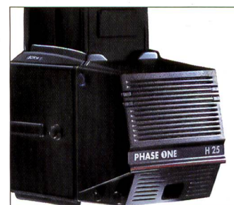
Phase One H25 lässt sich dank quadratischem Gehäuse gut von Hoch- auf Querformat umlegen.