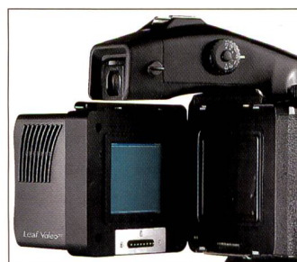
Leaf Valeo 22 setzt auf eine Festplatte, die am Stativgewinde der Mamiya 645 AFD angedockt wird.