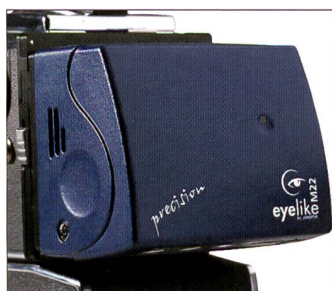
Eyelike Precision M22 wird dieser Tage erstmals der Öffentlichkeit vorgestellt.

Mittelformatkameras sind deshalb wieder im Einsatz, weil sich mit ihnen die neusten Generationen von Digitalrückteilen einsetzen lassen, zum Einen spart dies Kosten, wenn diese sowohl an Fach- und Mittelformatkameras adaptiert werden können, zum anderen sind die neuen Sensoren so gross, dass sie den Bildkreis von Kleinbildkameras übertreffen und beinahe einem 645er Filmnegativ entsprechen. Und nicht zuletzt verfügen viele Fotografen bereits über eine um-