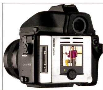
Imacon Ixpress hat den für digitale Kleinbildkameras üblichen Farbmonitor auf der Rückwand.