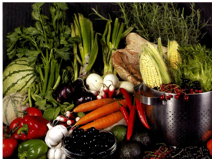
Stilllife-Fotografie ist die Paradedisziplin der Digitalrückteile. Bei sehr grossen Bildausgaben sind Rückteile mit Multishot allerdings im Vorteil. Bild: Phase One H25

es noch Dalsa (vormals Philips), der schon seit Jahren mit Sensoren für Profikameras eine Führungsposition einnimmt. Dalsa hat bei der Erscheinung des Kodak-Sensors ebenfalls eine Entwicklung vorausgesagt und ist jetzt mit einem gleich grossen 22-Megapixel-Chip in den Rückteilen der Marken Leaf und Eyelike vertreten. Die Ankündigung von Fujifilm an der PMA dieses Frühjahrs, bis Herbst ein Rückteil mit etwas über 20 Millionen Pixel auf der Basis des Super-CCD's auf den Markt zu bringen, hat sich bisher nicht verwirklicht.