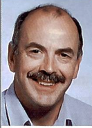
Martin Leuzinger Sektion VFS, Bern Impuls