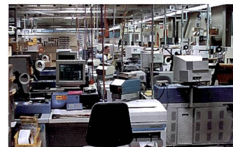
Geht an Pro Ciné: Der ganze Fachhandelsbereich unter Lizenz.

Der ganze Bilderservicebereich für den Fotofachhandel wird unter Lizenz der Pro Ciné in Wädenswil übergeben, unter der Voraussetzung, dass der Betriebsrat dieser Lösung zustimmt. Das bisherige Versandgeschäft wird ebenfalls aufgegeben, in dem die Adressen an einen noch nicht bekannten Partner verkauft werden. Bleibt zum Schluss die Frage nach der Zusammenarbeit