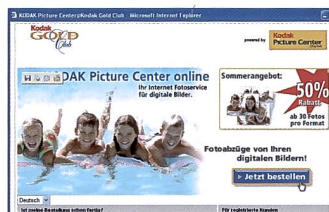
Bleibt: Der Internetdienst unter www.kodak.ch .

geworden sind, dass sie diesen Einbruch wettmachen würden. Auch scheint eine diesbezügliche Trendwende noch in weiter Ferne. Doch «die Entwicklung des Digitalmarktes zwingt Kodak zum Handeln» vermerkt die offizielle Pressemitteilung, und «Kodak könne nicht mehr länger zuwarten».