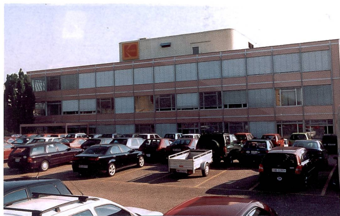
Der Schweizer Hauptsitz der Kodak SA in Renens wo per Ende Jahr 97 von 226 Angestellten ihren Job verlieren werden.

Wenn eines der grössten Fotolabore der Schweiz schliesst, dann ist das ein Schock für die ganze Branche. In erster Linie natürlich wegen der 97 Angestellten, die ihren Arbeitsplatz verlieren, in zweiter Linie, weil diese Massnahme ein Fingerzeig für die Entwicklung in unserer Branche darstellt.