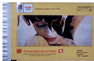
Wird verkauft: Der Mailorder-Bereich.

Kodak wird sich in Zukunft stärker um die Digitalfotografie kümmern und den analogen Bereich nur punktuell weiter fördern. Das scheint nicht nur die Doktrin der Lausanner Geschäftsleitung zu sein, sondern auch diejenige des amerikanischen Hauptsitzes in Rochester.