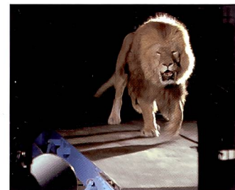
Der Löwe auf dem Laufband – einmal lief dieses zu schnell und Simba fiel verduzt hinten hinunter.

Der Löwe Simba wurde in einem fahrbaren Käfig auf das Set gerollt und auf das Laufband gelockt. Mit dem Einschalten des Bandes begann Simba zu trotten, gelockt von einem Fleischstück an einer Stange. Löwen sind Kurzstreckenjäger: Nach ein paar Minuten wurde das Männchen müde und legte sich auf das Band um auszuruhen. Die Gelegenheit ergab sich so, Aufnahmen mit liegendem Löwen zu schiessen. Damit die Bilder dynamisch wirkten, lieferte eine Windmaschine eine steife Brise. Leo, der nächste Löwenmann erwies sich als wilder, aggressiver