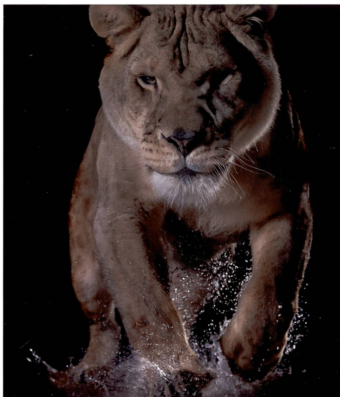
Nala, das Löwenweibchen, springt von einem Podest in ein flaches Becken mit Wasser – Werbeaufnahme für die Bank Leu.

Was macht ein Fotograf, wenn er für die Werbekampagne einer namhaften Bank Löwen fotografieren muss? Kauft er sich ein Zoo- oder Zirkusbillett oder gar ein Flugbillett in die Serengeti? Riskiert er Kopf und Kragen? Ein französisches Studio hat sich auf Tierfotografie spezialisiert.