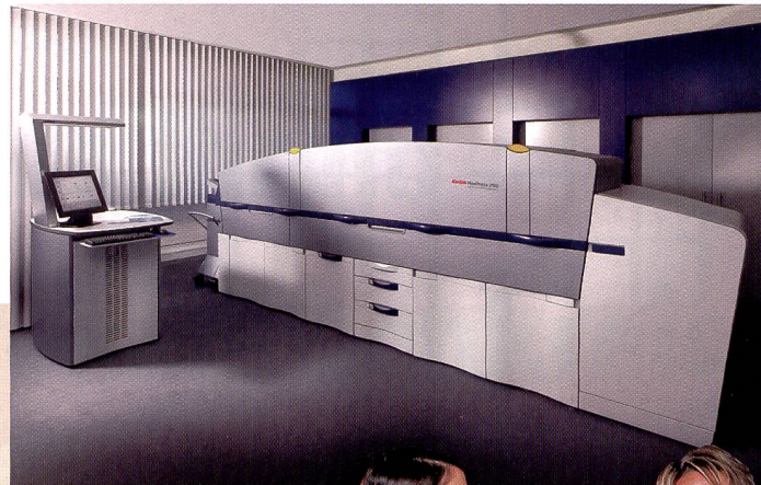
Mit Kodak Nexpress lassen sich digitale Druckaufträge realisieren wie die boomenden gebundenen Fotoalben.