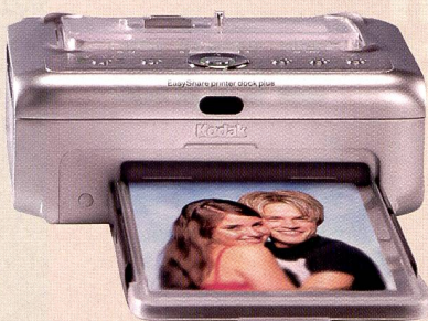
Printer Dock Plus: Einfach die Bilder zu Papier bringen, auch ab Handy.