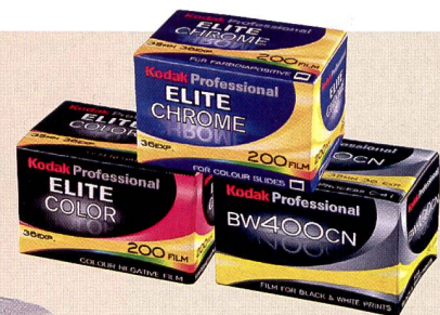
Kodak Filme gehören nach wie vor zum wichtigen Standbein des Sortiments.