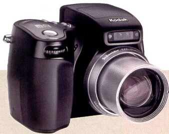
Die DX 7590 Easy Share: 10fach-Zoom und 5 Megapixel Auflösung in einem kompakten Gehäuse – eine qualitativ hochstehende und doch einfach zu benutzende Digitalkamera.

Lösungen für «on demand Colour Printing» sind Teil der Commercial Printing Abteilung, die kürzlich