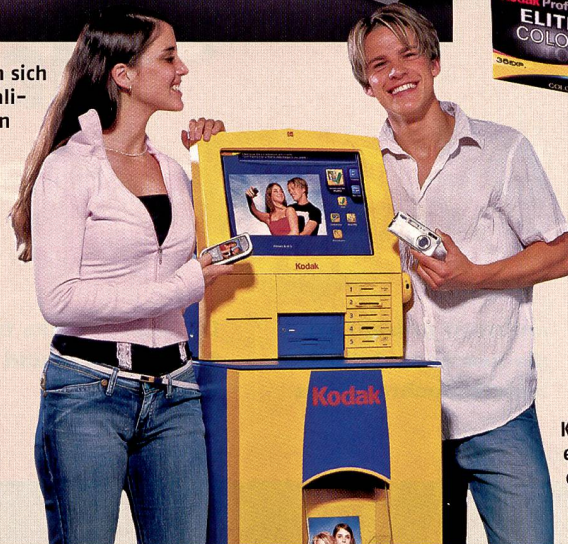
Kodak Fotokioske haben ein grosses Potential für den Ausdruck von Bildern ab digitalen Medien wie Fotohandys.

vollständig von Kodak übernommen wurde. Mit Versamark für variables data printing und dem Inkjet-Printer-Programm Encad stellt diese Abteilung ein enormes Wachstumspotential für Kodak dar. Die Nexpress Ausrüstungen ermöglichen beispielsweise die Realisierung von digitalen Fotoalben, nach denen in den Fotokanälen grosse Nachfrage herrscht.