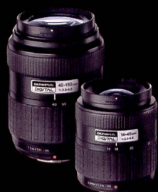
ZUIKO DIGITAL OBJEKTIVE 40-150 mm f3,5-4,5 UND 14-45 mm f3,5-5,6