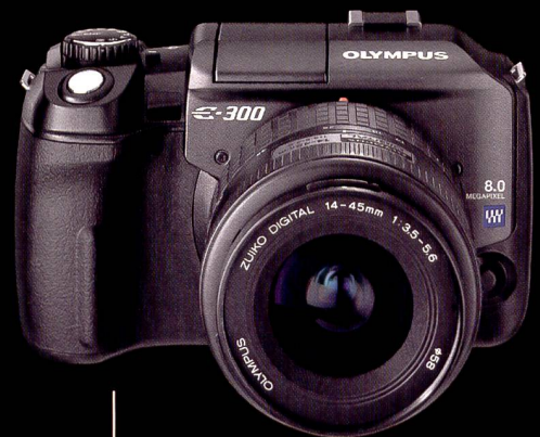
DIE NEUE OLYMPUS E-300

Mit der OLYMPUS E-300 hat die Zukunft begonnen. www.olympus-pro.com