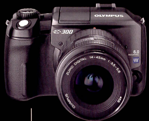
DIE NEUE OLYMPUS E-300

Mit der OLYMPUS E-300 hat die Zukunft begonnen. www.olympus-pro.com