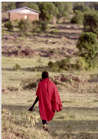
Moderne Zoomobjektive ermöglichen kurze Reaktionszeiten. Trotzdem überzeugen sie in punkto Schärfe und Farbwiedergabe.

Canon EOS 300D und der Nikon D70 hat sich zudem ein neues Marktsegment eröffnet. Viele engagierte Hobbyfotografen hatten entweder mit einer kompakten Kamera erste Erfahrungen mit der digitalen Fotografie gesammelt oder zugewartet, bis die neue Technologie den Kinderschuhen entwachsen ist. Anwender haben zudem eine grosse Auswahl an Objektiven, sowohl herkömmliche