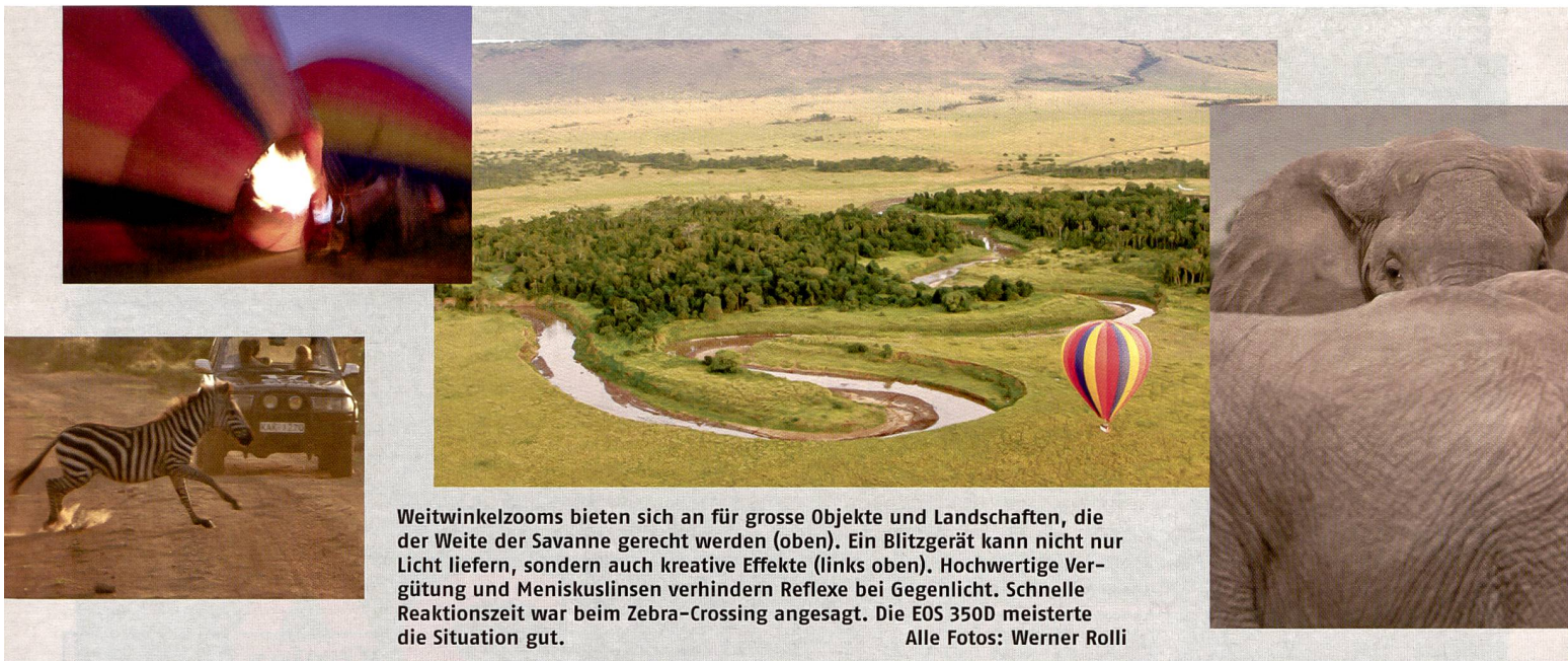
Weitwinkelzooms bieten sich an für grosse Objekte und Landschaften, die der Weite der Savanne gerecht werden (oben). Ein Blitzgerät kann nicht nur Licht liefern, sondern auch kreative Effekte (links oben). Hochwertige Vergütung und Meniskuslinsen verhindern Reflexe bei Gegenlicht. Schnelle Reaktionszeit war beim Zebra-Crossing angesagt. Die EOS 350D meisterte die Situation gut.

Moderne Zoomobjektive sind sehr leistungsfähig. Es ist deshalb durchaus möglich, während einer ganzen Safari mit einem einzigen Objektiv, wie etwa dem 1:3,5-5,6/28-300mm L IS USM auszukommen. Dank Bildstabilisation liegen hier bis zu zwei Verschlusszeitenstufen Reserve drin. Der CMOS-Sensor der EOS 350D ist kleiner als ein Kleinbildnegativ, aber grösser als Sensoren in Kompaktkameras. Bei Wechselobjektiven ist ein Verlängerungsfaktor von