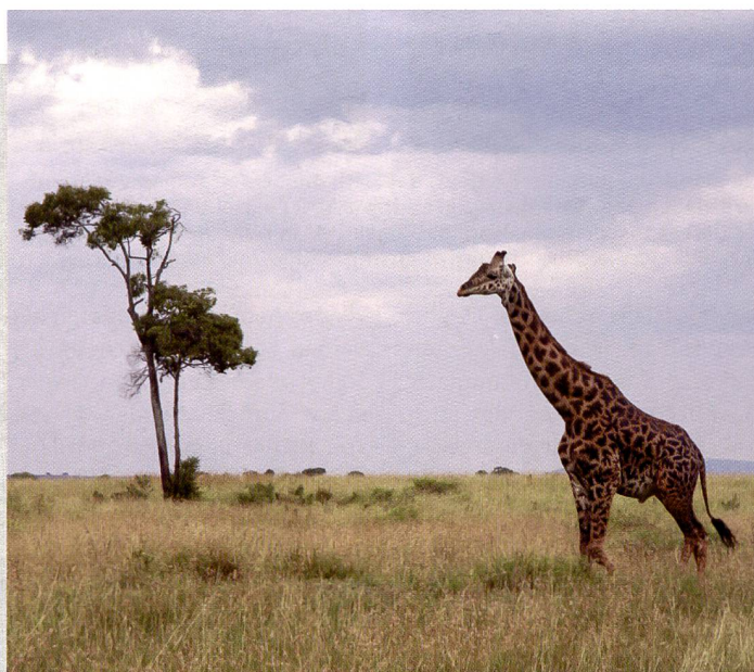
Es empfiehlt sich, die ISO-Einstellung der Kamera auf 400 einzustellen, dadurch werden kürzere Verschlusszeiten möglich. Bei der springenden Löwin stiess die EOS 350D an ihre Grenzen - trotz schneller Bildfolge.