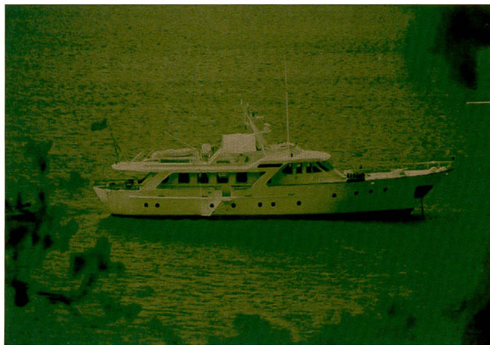
Gerade im Wassersport können Nachtsichtgeräte ein Sicherheitsfaktor sein, wenn Radargeräte durch hohen Seegang oder in Binnengewässern kleinere Boote nicht wahrnehmen können.

ursprünglich für militärische Anwendungen bereits vor dem zweiten Weltkrieg erfunden, bieten moderne Nachtsichtgeräte auch privaten Anwendern heute zu einem guten Preis viele Einsatzmöglichkeiten, sei es in der Jagd, im Sport, in der Tierbeobachtung oder schlicht um die Neugierde über das nachbarschaftliche Treiben zu befriedigen.