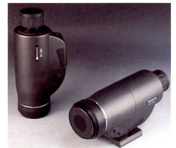
Während das NV 300 (links) von Minox noch ein Generation 1+ Gerät ist, arbeitet das NV 400 bereits im 2+ Standard.

Mit Hilfe eines weiteren Plättchens, dem «Phosphorschirm» wird anschliessend der Strom wieder in Licht gewandelt. Die