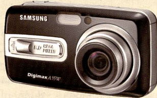
Die Samsung Digimax A55W verfügt über ein 4,8fach-Zoom mit Weitwinkel und Bildstabilisierung bei Videoaufnahmen.