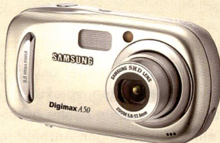
Die Samsung Digimax A50 zeichnet sich in der 5 Mpix-Klasse durch ein interessantes Preis-/Leistungsverhältnis aus.