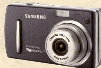
Die Samsung Digimax L50 ist mit einem optischen Dreifachzoom und MPEG4-Technologie ausgestattet.