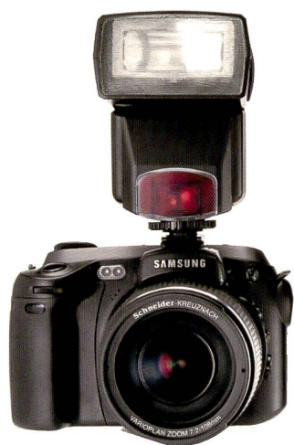
Zur Samsung Pro815 gibt es neben dem Aufklappblitz auch ein externes Blitzgerät mit Leitzahl 42, Schwenkreflektor und einen variablen Ausleuchtungswinkel.

Was auf der PMA als gezeichnete Zukunftsvision eine Wand zierte (siehe Fotointern 4/05) soll in wenigen Wochen auf den Markt kommen: Die Samsung Pro815 , eine All-in-one Konstruktion mit dem größten Zoombereich von 15fach und einem CCD-Sensor mit acht Megapixel Auflösung. Das Objektiv 1:2,2-4,6/7,2-108 mm (entspricht 28-420 mm bei Kleinbild) von Schneider-Kreuznach soll durch vier Speziallinsen mit niedrigen Brechungsindizes und zwei asphärischen Linsen über den gesamten Brennweitenbereich eine sehr gute optische Qualität aufweisen. Die Bilder können auf dem grossen 3,5-Zoll-Monitor mit Micro Reflective Technologie mit 16,7 Millionen Farben in einem breiten Betrachtungswinkel beurteilt werden. Ferner ist die Kamera mit einem elektronischen Sucher und einem 1,4-Zoll-Monitor auf der Kameraoberseite für unbemerkte Aufnahmen ausgestattet. Der neuartige 7,4 Volt 1900 mAh Lithium-Ion-Akku soll für rund 500 Bilder ausrei-