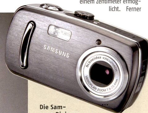
Die Samsung Digimax V800 ist das Topmodell der V-Reihe mit 8 Mpix Auflösung und MPEG4-Kompression.