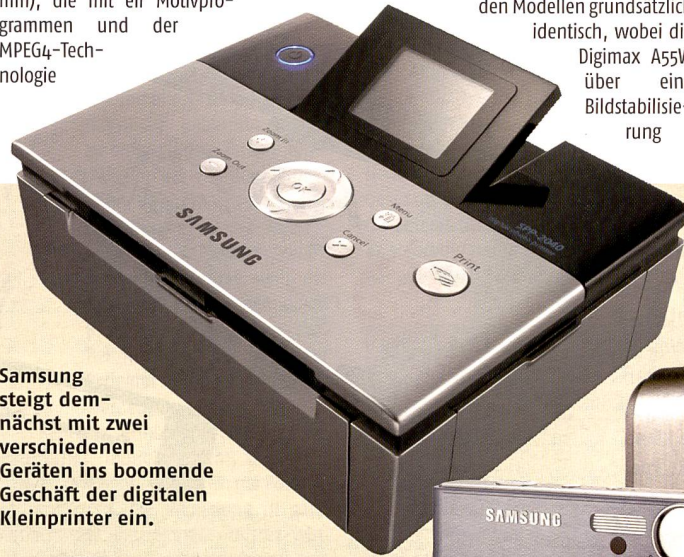
Samsung steigt demnächst mit zwei verschiedenen Geräten ins boomende Geschäft der digitalen Kleinprinter ein.