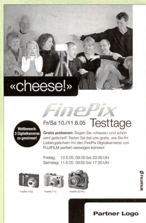
Vorlage für ein Inserat in der lokalen Zeitung.

chend, sondern mittelfristig vielmehr ruinös. Mit den nun lancierten Testtagen beschreitet die Fujifilm (Switzerland) AG neue Wege: Die potenziellen Käuferinnen und Käufer sollen sich ganz direkt und im alltäglichen Einsatz von den Möglichkeiten und Qualitäten der FinePix-Kameras überzeugen können.