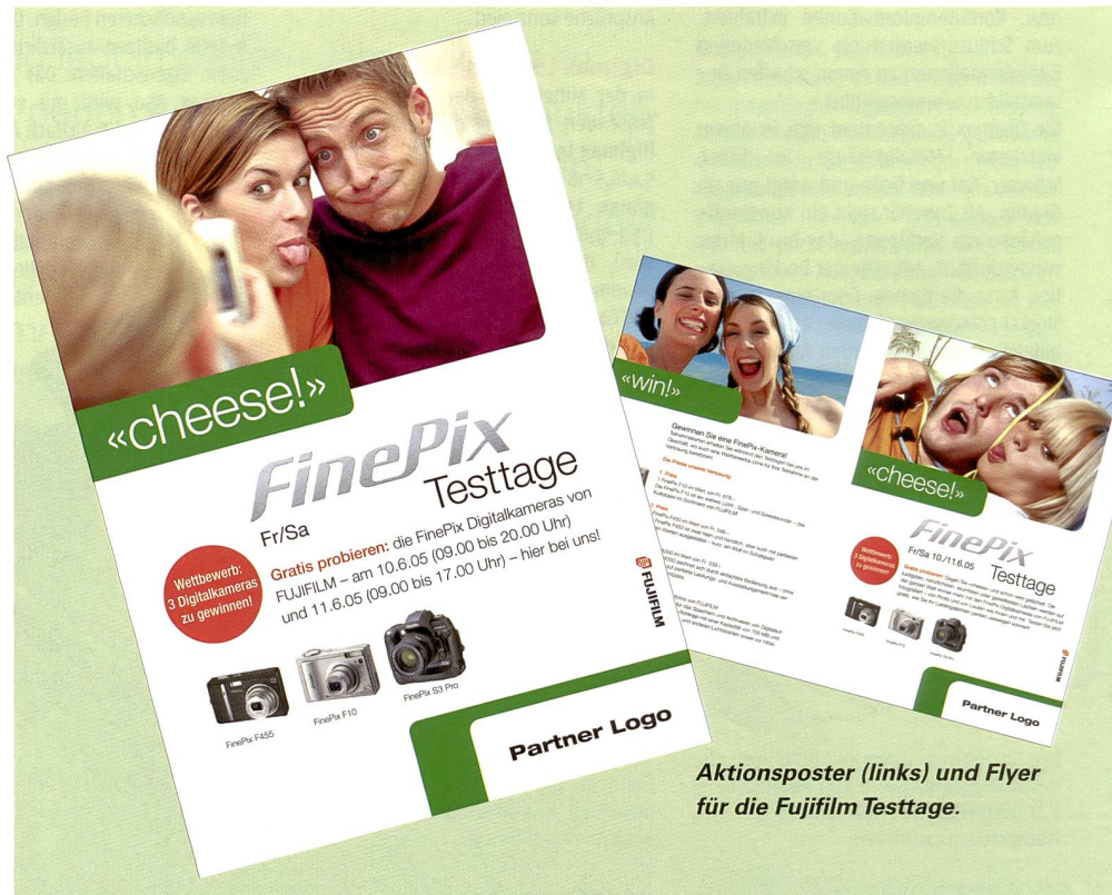
Aktionsposter (links) und Flyer für die Fujifilm Testtage.

Die Erfahrung zeigt, dass dem Kaufentscheid für eine Digitalkamera sehr oft eine reine Markenwahl zugrunde liegt. Derjenige Anbieter mit dem (subjektiv) besten Image hat dabei die grösste Chance, sich durchzusetzen. Was tut eine kleinere Marke, die qualitativ mindestens ebenbürtig, als Kamerahersteller aber eben weniger bekannt ist? Der Weg über die klassische Image- und Produktwerbung ist nicht nur enorm kosten-, sondern auch ausserordentlich zeitintensiv. Und der reine Preiskampf ist letztendlich auch kaum erfolgsverspre-