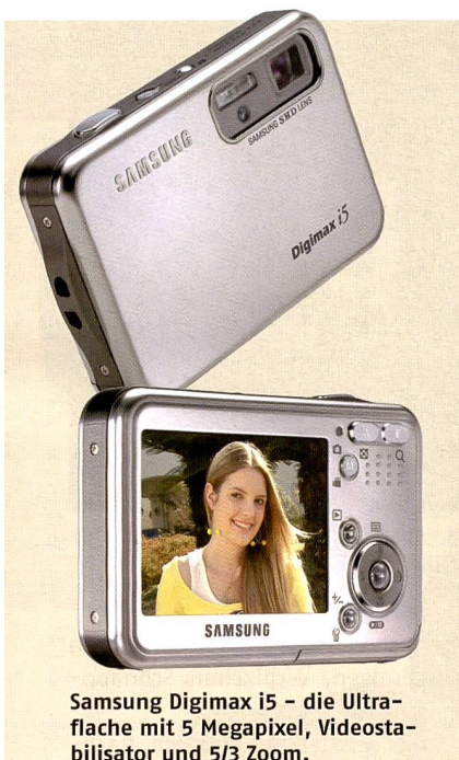
Samsung Digimax i5 – die Ultraflache mit 5 Megapixel, Videostabilisator und 5/3 Zoom.

Superflache Kameras sind im Trend. Mit der nur 17 mm flachen Digimax i5 will Samsung auch in diesem Marktsegment ganz vorne mit dabei sein. Sie ist mit einem 5 Mpix-CCD ausgestattet und verfügt über ein vertikal integriertes 3x-Zoom 1:3,5-4,5/6,6-19,8 mm (entspricht bei KB 39-117 mm), das in seiner Super-Makrostellung Nahaufnahmen bis zu einem Motivabstand von einem Zentimeter ermöglichen. Ferner