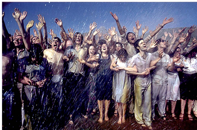
Wohin geht der Bildermarkt? Was ist der Kundengeschmack? Welche Bildagenturen gibt es in der Schweiz und was bieten sie an? Fotointern hat eine Umfrage unter den Anbietern von Bilddatenbanken gemacht.

Der Bildermarkt ist ständig in Bewegung, Trends kommen und gehen, wirtschaftliche und gesellschaftliche Strömungen prägen die Art und Weise, wie Bilder für die Kommunikation eingesetzt werden. Wir wollten die Meinung der Profis wissen und haben dazu sechs Bildagenturen befragt.