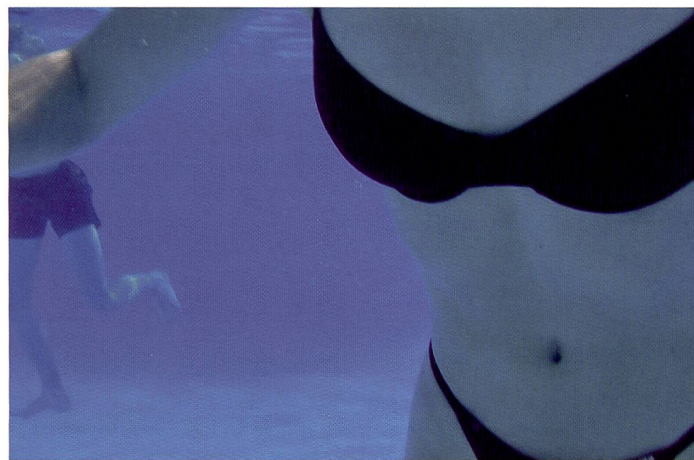
Unterwasserbild mit der Pentax Optio WP: gegenüber Unterwassergehäusen ist die Kamera bezüglich Bedienungsfreundlichkeit im Vorteil – dafür ist sie aber nur bis zu einer Tiefe von 1,5 Meter ausgelegt.

(bis zu 30 Minuten). Die Strapazierfähigkeit wird auch durch Schutzpolster an allen Seiten und im Objektivbereich gewährleistet. Dabei ist es von Vorteil, dass die leichte Kamera dank grosser Bedienungselemente einfach zu handhaben ist. Mit einer geringen Auslöseverzögerung von 0,14 Sekunden und der Aufnahmebereitschaft rund 1,8 Sekunden nach dem Einschalten ist sie eine ideale Schnappschusskamera, kann aber auch für den beruflichen Outdoor-Einsatz ideal sein. Verzögerungen gibt es nur beim Aufladen des Blitzgerätes. Praktisch