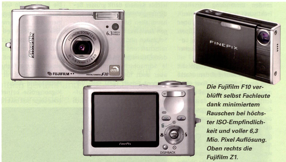
Die Fujifilm F10 verblüfft selbst Fachleute dank minimiertem Rauschen bei höchster ISO-Empfindlichkeit und voller 6,3 Mio. Pixel Auflösung. Oben rechts die Fujifilm Z1.

www.dpreview.com ). Dahinter steckt das neue Gesamtkonzept von Fujifilm, welches den Namen «Real-Photo-Technology» trägt.