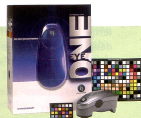
Das Eye-One Photo gibt es als Paket SG mit dem grossen Munsell ColorChecker SG oder dem Mini ColorChecker Testchart