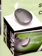
Das Eye-One Display 2

upgraden. Ein weiterer Vorteil liegt darin, dass die Hard- und Software vom gleichen Hersteller kommen und damit deren perfektes Zusammenspiel garantiert ist.