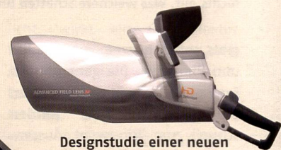
Designstudie einer neuen Fernsehkamera, deren Signal drahtlos  bertragen werden soll.

SED (Surface-conduction Electron-emitter Display) hei t die neue Technologie f ur hochaufl osende Farbmonitore, die Canon zusammen mit Toshiba entwickelt hat.