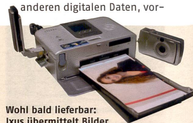
Wohl bald lieferbar: Ixus  bermittelt Bilder per WLAN an den Drucker.

Das total vernetzte Heim ist keine Utopie mehr. Was WLAN im Bereich der Daten bertragung f ur Internet, bald aber auch f ur alle anderen digitalen Daten, vor-