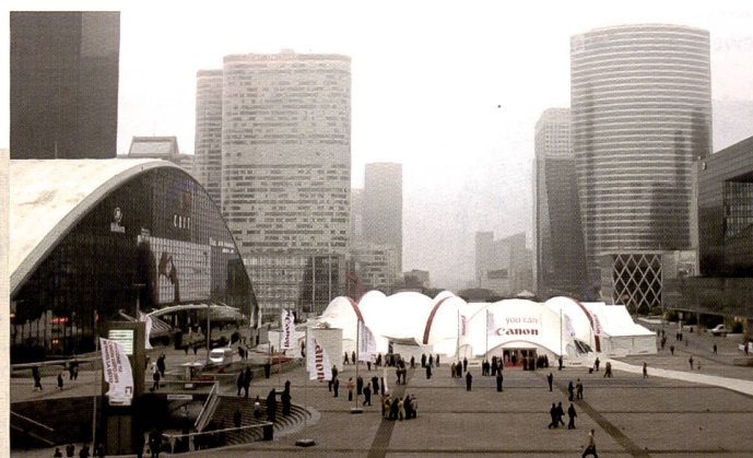
In verschiedenen Lokalitäten in der Pariser D efense besuchten  ber 14'500 G aste aus ganz Europa die Technologieschau von Canon.

Alle fünf Jahre gewährt Canon Einblick in ihre neuesten Technologien und stellt Prototypen, Designstudien oder Verfahren vor, die unmittelbar, längerfristig (oder vielleicht auch gar nie) zu neuen Produkten führen.