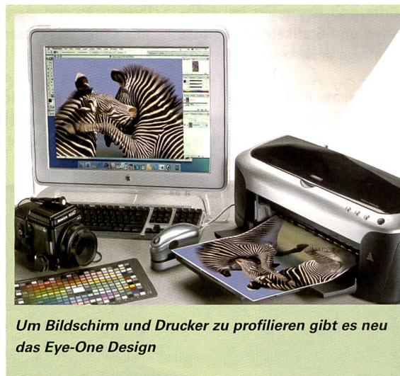
Um Bildschirm und Drucker zu profilieren gibt es neu das Eye-One Design

Gerade der Geschäftsbereich Digital Imaging mit der Eye-One Produktlinie erfreut sich in der bildverarbeitenden Industrie grösster Beliebtheit. Der grosse Erfolg den Gretag Macbeth mit diesen Produkten in den letzten Jahren hatte, zeigt auch, dass Farbmanagement keine Nischenapplikation mehr ist. Gerade das Vorurteil, dass Farbmanagement kompliziert und teuer sei, hat Gretag Macbeth dank benutzerfreundlicher Software und attraktiven Preisen entkräftet. Darüberhinaus überzeugt das modulare Konzept der Eye-One Produkte, denn jeder Kunde kann mit geringen Zusatzinvestitionen seine bereits bestehenden Geräte