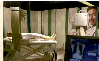
Digitales Röntgen – auch mit mobilen Geräten – ist bei Canon ein wichtiges Thema.

Canon hat diese Neuausrichtung bereits durch die Bekanntgabe der Übernahme der beiden japanischen Tochtergesellschaften von NEC, NEC Machinery und