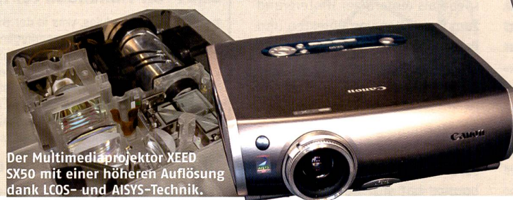
Der Multimediaprojektor XEED SX50 mit einer h oheren Aufl osung dank LCOS- und AISYS-Technik.

in der Kleindruckbranche, bei Medizinalsystemen, als Industrieausstatter und in der Umwelttechnologie ganz vorne mit dabei.