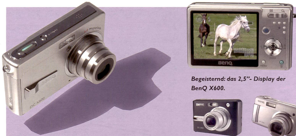
Nur 1,9 cm «dünn» ist die BenQ X600, die ausserdem über einen 6-MPix-CDD, ein Pentax-Dreifachzoom und ein 2,5"-Display verfügt.

Fotografieren liegt wieder im Trend, mit dem Aufschwung der Digitaltechnologie ist die Kamera zu einem «Immer-Dabei-Produkt» geworden. BenQ hat erkannt, dass dabei Lifestyle-Design und kompakte Bauweise die Nase vorn haben. Die Baureihe umfasst aktuell 9 Produkte, die in einem kostengünstigen Segment bei höchster Qualität ein breites Spektrum an Bedürfnissen abdecken. Noch in diesem Jahr sind zwei weitere Neuheiten angekündigt. Die Elegant-Linie beginnt bei der DC E300, einer einfachen Kamera mit 3 Megapixeln (CMOS) und Festbrennweite für 129,- Franken. Alle anderen Modelle verfügen mindestens über 5 Megapixel aus einem CCD-Sensor und die meisten haben ein dreifaches Zoom.