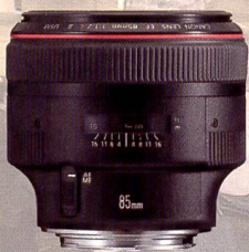
Das überarbeitete Canon 85 mm Objektiv kommt im April auf den Markt.