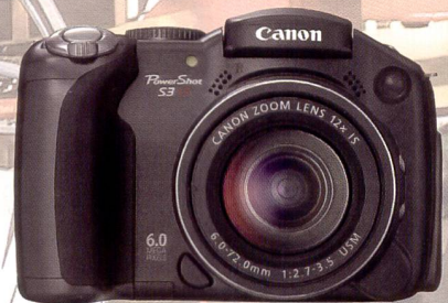
Mit 6 Megapixel: Canon Powershot S3 IS.