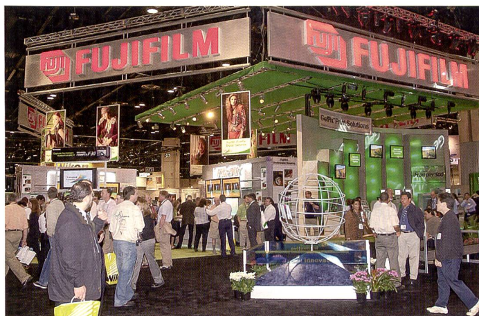
Der Film ist tot – es lebe der Film: Fujifilm setzt trotz Digitalwelle auch auf das Filmbusiness und den Bildermarkt, mit einem neuen Film, einem neuen Minilab und zwei neuen Einfilm-Kameras.

Tamrac hat hier in Orlando die neue Rucksack-Reihe Adventure Photo Backpacks 5549, 5547 und 5546, bzw. Adventure 6, 7 und 9, vorgestellt. Sie haben grosse, frei einteilbare Fächer für die Kameraausrüstung und ein weiteres Fach für Kleider oder Utensilien gemeinsam. Alle Taschen und Rucksäcke sind mit Fächern für Speicherkarten ausgestattet. Die Rucksäcke sind mit einer Befestigung