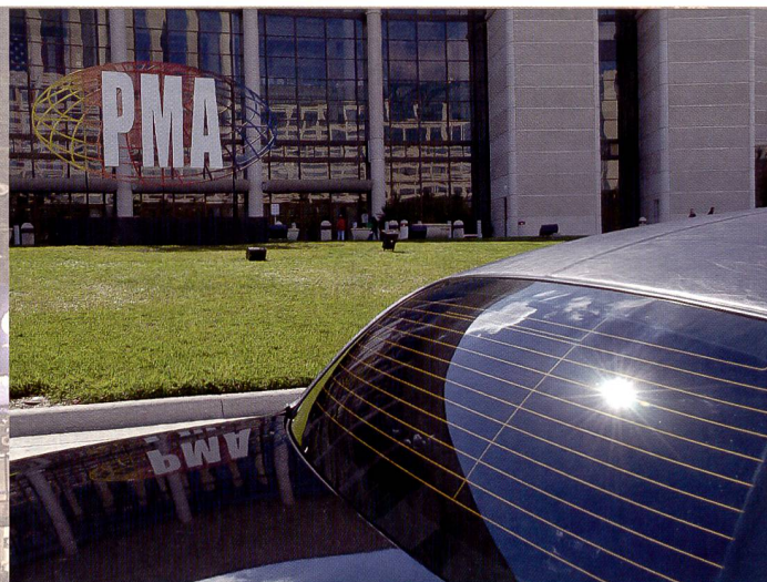
Neue Marken im Imaging-Geschäft, andere, die schmerzlich fehlen. Die PMA in Orlando zeigt den Trend der Fotoindustrie, unter anderem auch das Drängen aller Hersteller in den High-End-Amateursektor mit digitalen Spiegelreflexkameras.