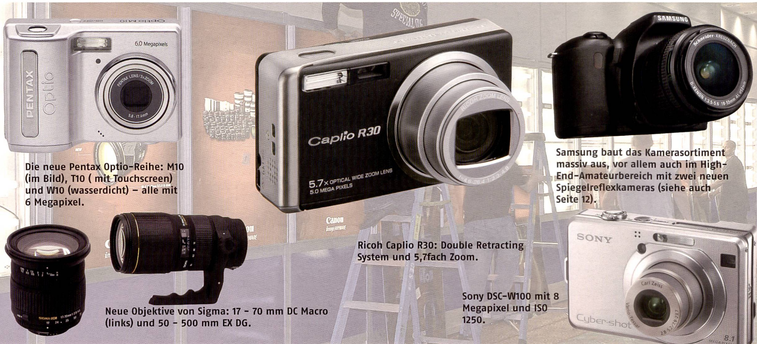
Die neue Pentax Optio-Reihe: M10 (im Bild), T10 (mit Touchscreen) und W10 (wasserdicht) – alle mit 6 Megapixel.

Sigma hat ausserdem 5 neue Objektive für das 4/3 System angekündigt. Es handelt sich um folgende Typen: 1:1,4/30mm EX DC HSM; 1:2,8/18–50mm EX DC; 1:2,8/105mm, EX DG, APO Makro, 1:2,8/150mm EX DG