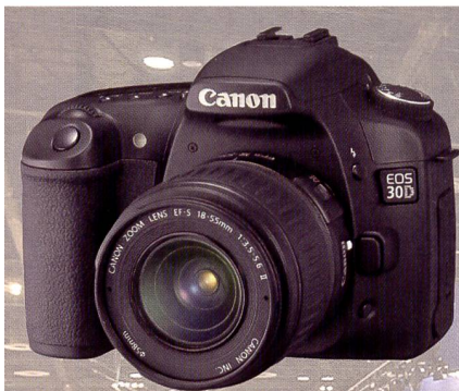
Die Canon EOS 30D tritt mit 8,2 Megapixel die Nachfolge der 20D an.

Die kleine F650 verfügt über 6 Megapixel und ein 5faches optisches Zoom. Als Besonderheit sind der grosse 3-Zoll LCD-