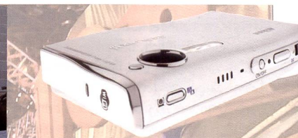
Ultraflach und mit Wireless-Anbindung: Nikon Coolpix S6.