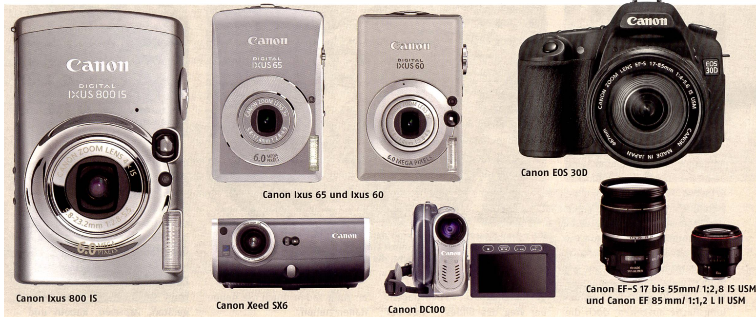
Canon Ixus 800 IS

und höchste Leistung bei schlechten Lichtverhältnissen – ideal beispielsweise für Porträt-Aufnahmen. Ausserdem verstärkt Canon die EF-S-Serie mit einem neuen Weitwinkelobjektiv mit Bildstabilisator: dem EF-S 17 bis 55mm/1:2,8 IS USM. Dieses Objektiv soll laut Canon an die Profibaureihe heranreichen insbesondere dank der durchgehenden Blendenöffnung von 1:2,8, wobei der Bildstabilisator noch bis zu drei Belichtungsstufen ausgleicht. Gebaut wurde das Weitwinkelzoom mit hochwertigen optischen Komponenten wie UD-Glas und asphärischen Elementen.