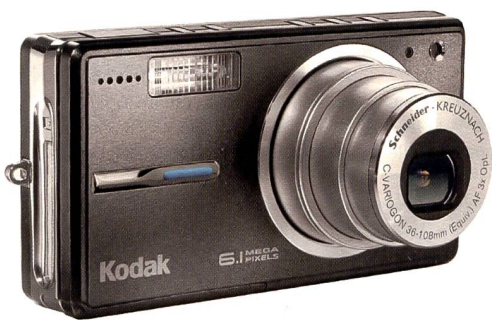
Kodak Easy Share V603: Bildbearbeitung «On Board» und Fernseh-Videoqualität mit 6,1 Megapixel Auflösung.

Für Einsteiger und Verbraucher, die sich eine unkomplizierte neue Digitalkamera zu günstigem Preis zulegen wollen, ist die Kodak EasyShare C643 konzipiert – eine kompakte und preiswerte Allroundkamera mit 6,1 Megapixel Auflösung, einem optischen 3fach Zoom, Video- und Ton-aufnahmen mit 30 Bildern/Sekunde in TV/VGA Qualität sowie Bildverbesserungs-funktionen in der Kamera. Das Display