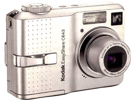
Kodak Easy Share C643: Handliche und unkomplizierte Einsteigerkamera mit optischem Dreifachzoom.