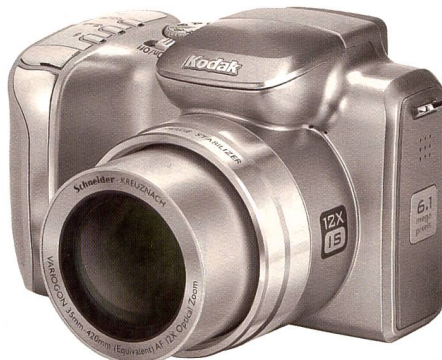
Kodak Easy Share Z612: 12fach-Zoom, 6,1 Megapixel Auflösung, Bildstabilisator mit schnellem Autofokus kombiniert.