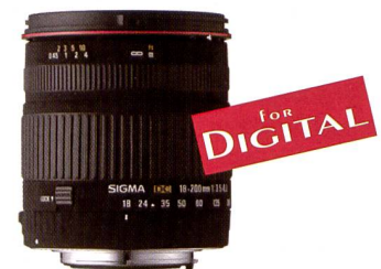
SIGMA 18-200 mm F3,5-6,3 DC IF

Ein speziell für digitale SLR-Kameras gebautes Hochleistungs-Zoomobjektiv – das leichteste und kompakteste seiner Klasse – hat die Szenerie dieses Momentes perfekt eingefangen. Das SLD (spezial low dispersion) beschichtete Glas und die asphärischen Korrekturlinsen garantieren eine hervorragende Bildqualität über den gesamten Zoombereich. Mit einem Gewicht von 385 g und einer Länge von 75,6 mm, begeistert das Sigma 18-200 mm durch seine leichte und kompakte Bauweise. Die Innenfokussierung erlaubt den Einsatz einer tulpenförmigen Gegenlichtblende und Zirkular-Polarisationsfiltern. Erhältlich für Sigma-, Canon-, Nikon-, Konica Minolta- und Pentax-Kameras mit APS-C Sensorgrößen.