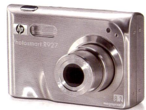
HP PHOTOSMART R 927

www.hp.com/ch/digitalefotografie HP – the leading printing company