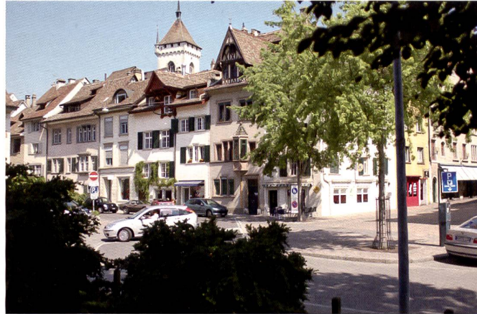
Das Testbild weist eine hohe Farbbrillanz und einen guten Dynamikumfang auf. Die gesättigten Grüntöne wirken im Kontext zu den kräftigen roten Partien harmonisch und können durch eine leichte Korrektur der Gradationskurve bereinigt werden. Sehr schön die Absenz von Rauschen.

können. Dabei ist auch die Frage nach der Hygiene, sprich: Staubpartikel auf dem Sensor nicht im selben Masse aktuell, wie bei herkömmlichen Digitalkameras.