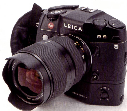
Der Austausch der Rückwand durch ein digitales Modul macht aus der Leica R9 eine moderne DSLR-Kamera mit allen Möglichkeiten. Die Digitalrückwand wird seit Juni ausgeliefert.

Rund zwei Jahre sind es her, seit Leica das Digitalmodul für ihre R-Spiegelreflexkameras angekündigt hat. Seither ist viel passiert und viele Anwender fragen sich, was die Lösung, eine Spiegelreflexkamera mit einem Rückteil auszustatten, bringt. Wir haben die Kombination auf Herz und Nieren geprüft.