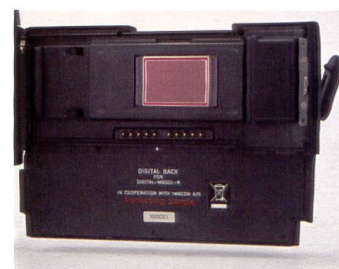
Alles in der Rückwand: der Sensor kommt genau in der Bildebene der Kamera zu liegen.

Am besten löst man Hochformataufnahmen mit dem Mittelfinger aus. Selbstverständlich ist auch der traditionell im Verschlusszei-