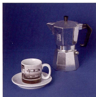
Bluebox-Aufnahmen zum einfachen Freistellen der Objekte.

scheinende Hintergründe. Dank dem mitgelieferten Stoffhintergrund wirken auch einfache Aufnahmen professioneller. Der Stoffhintergrund ist beidseitig verwendbar. Die graue Seite wird beispielsweise dann verwendet, wenn ein farbiger Spot der Aufnahme etwas Pep verleihen soll. Der blaue Hintergrund erleichtert bei der anschliessenden Bildbe-