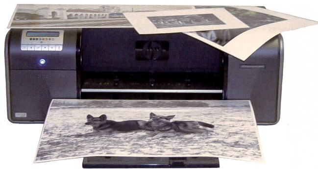
Kunstvolle Schwarzweiss-Drucke gelingen dank den Vivera-Tinten mit zwei Schwarzpatronen und zusätzlicher Grautinte besonders gut.

Fotointern hatte die Gelegenheit, das ab August in der Schweiz lieferbare Gerät mit einer Vorabversion der Software zu testen.