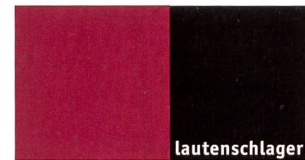
foto lautenschlager ag bionstrasse 5 ch-9015 st.gallen

fon +41 71 278 15 35 fax +41 71 278 15 37 www.foto-lautenschlager.ch info@foto-lautenschlager.ch