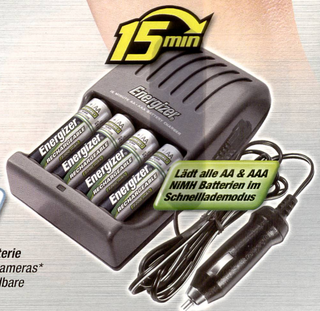
Energizer 15 Minuten Ladegerät