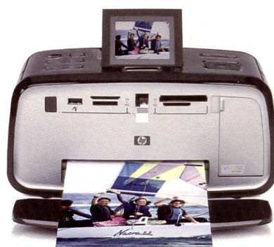
HP PHOTOSMART A717