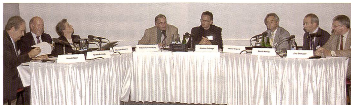
Hochkarätige Teilnehmer an der Podiumsdiskussion sind jedes Jahr die Voraussetzung für ein spannendes ISFL / VFS Marketing-Forum.

Das Marketing-Forum findet am Montag, 30. Oktober 2006 um 13.30 Uhr im Swissôtel, Zürich-Oerlikon statt. Die Veranstaltung inkl. Kaffeetreffen dauert bis ca. 16.30 Uhr. Die Kosten pro Teilnehmer betragen CHF 50.-. Das Anmeldeformular kann unter www.is-fl.ch/events.asp als PDF heruntergeladen werden oder direkte Anmeldung bei: ISFL, Postfach 7039, 8023 Zürich Fax 044 215 99 77 E-Mail: b.wiedemeier@swhch.com