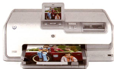
HP PHOTOSMART DZ360