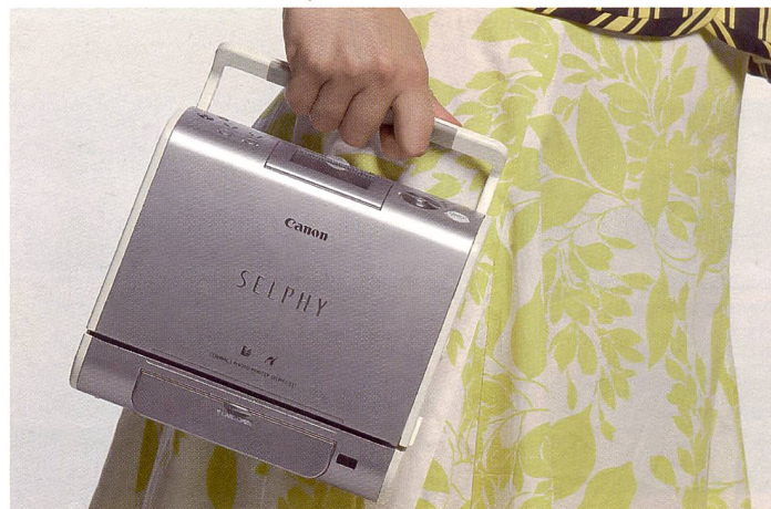
Der Canon Selphy ES1 wartet mit einer neuen Kombination von Folienkartusche und Printerpapier auf, die besonders einfach zu handhaben ist und bis zu 50 Prints beinhaltet. Er ist ab jetzt im Handel erhältlich und kostet CHF 358.-.

Wir haben schon vermehrt Marktübersichten von den aktuellen kleinen Fotodruckern gebracht (Fotointern 10/06). Nun haben wir das jüngste Modell der Canon-Familie, den an der Photokina präsentierten Selphy ES1 mal gründlich unter die Lupe genommen und Postkarten damit produziert.