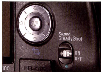
Mit dem Schalter unten rechts wird der Super Steady Shot aktiviert. Der Sensor ist schwebend befestigt, dadurch kann die Bildstabilisation mit allen Objektiven verwendet werden.

merhin sind das Stativgewinde und das Objektivbajonett aus Metall. Erstaunlicherweise verfügt die Sony α 100 über einen Kartensteckplatz für Compact Flash Kar-