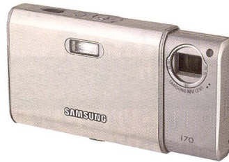
Samsung i70 mit 7,2 MPix.

messung kann bei der S1050 auch punktgenau mit Spot-Charakteristik und ihrem engen Messwinkel gearbeitet werden. Die S1050 reduziert die Gefahr des «Rote-Augen-Effekts» durch die Red Eye Fix-Technologie. Weitere Betriebsmodi sind das Blitzen mit langer Verschlusszeit sowie Aufhellblitzen. Die Reichweite liegt