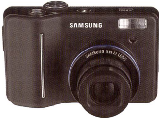
Das neue Topmodell in Samsungs Kompaktklasse: Samsung S1050.

Sieben neue Kompaktkameras hat Samsung auf der CES vorgestellt. S1050 heisst das neue Topmodell in der Kompaktklasse von Samsung. Der 1/1,8"-CCD-Sensor verfügt über 10,1 Megapixel, was Bilder mit Abmessungen von maximal 3648 x 2766 Pixel ergibt. Die Kamera ist mit einem SHD-Objektiv ausgestattet. Dieses