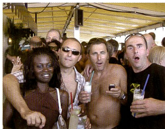
Beispielfoto: Reto Niederhauser

Die Teilnahme ist sehr einfach. Downloaden und lesen Sie die Teilnahmebedingungen, lassen Sie sich einen knackigen Titel einfallen und laden Sie Ihr Foto mit Hilfe der Erfassungsmaske auf den Server. Das Foto wird beim Hochladen automatisch auf die richtige Grösse formatiert.