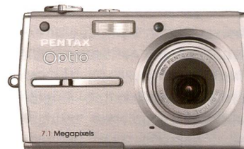
Die neue Pentax Optio T30.

Dank dem Sliding Lens System ist die Kamera schlanker. In der Funktion «MyDra-